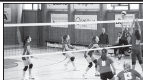
Z druhého stretnutia junioriek Žiar nad Hronom – Spišská Nová Ves (2:3).