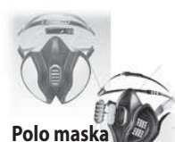
Polo maska s filtrom - 25€