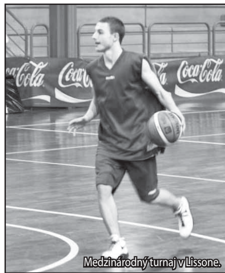
Medzinárodný turnaj v Lissone.