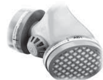
Midimask - 6€

Je typom tvárovej masky s gumotextilným päť páskový upínacím systémom. Lícnicia má oválne, panoramatické zorníky. Priezvučná vložka v strednej časti lícnicie umožňuje komunikáciu aj pri nasadení masky. Vnútroň okraj gumového výlisku lícnicie je vybavený tesniacou manžetou. Vo vnútri lícnicie je vsadená polomaska, ktorá oddeľuje priestor vdychovaného a vydychovaného vzduchu a zároveň znižuje zahmlievanie zorníkov. Laminátová ventilová komora obsahuje dva vydychovacie a jeden vdychovací ventilky. Závit ventilovej komory umožňuje pripojenie lícnicie ku všetkým ochranným filtrom typového radu MOF - MOF-2, MOF-4, príp. MOF-5 a MOF-6.