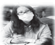
Ochranné rúško 1€

Skladací respirátor – s vdyčovým ventilom zaručuje ochranu proti pevným netoxickým časticiam neprevyšujúcim 10 – násobok najvyššej prípustnej koncentrácie pevných netoxických častí. Okrem obyvateľstva, ktoré si môže zabezpečiť