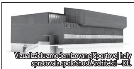
Vizualizácia zmodernizovanej športovej haly spracovala spoločnosť Architekti – DE.

Ešte koncom minulého roku avizovalo vedenie mesta zámer zrekonštruovať mestskú športovú halu. Na základe požiadaviek bola v týchto dňoch spracovaná architektonická štúdia.