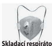
Skladací respirátor 3M 8810 2€