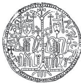
Averz mince z obdobia konca 12. a začiatku 13. storočia, na ktorej sú zobrazení králi Belo IV. a Ondrej II. Minca bola nájdená v minulom roku v Žiari nad Hronom.

V čase, keď sa formovala doba sídiel, fortifikačných (opevňovaných) zariadení, hradov a pod nimi vytvárajúcich sa mestských aglomerácií a v tom čase sa o mieste, na ktorom sa teraz rozkladá naše mesto, píše v jednej z najstarších listín. Viacero z archívnych záznamov sa vzťahuje