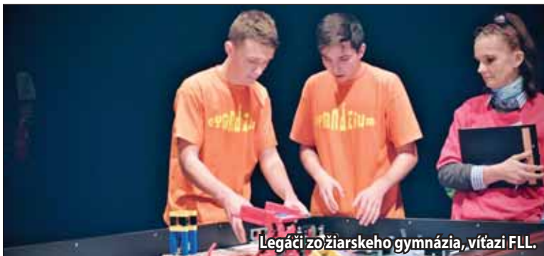
Legáči zo žiarskeho gymnázia, víťazi FLL.

vopred určenej odbornej téme a tento rok sa dvanásť zapojených tímov popasovalo s odbornou témou Trash Track – Spracovanie odpadu. Aby uspeli, musia svoju technickú zdatnosť, tímovú spoluprácu a prezentačné zručnosti dokázať v štyroch častiach, z ktorých