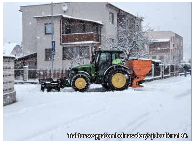
Traktor so sypačom bol nasadený aj do ulíc na IBV.

ostatné časti prichádzajú na rad až potom, čo býva v prípade snehovej kalamičnosti niekedy až v ďalšie dni. Pre obyvateľov mesta je k dispozícii aj Linka zimnej údržby, ktorá je vždy zapnutá. Žiarčania môžu teda na telefónne číslo 0915 317 044 volať v prípade otázok ohľadom zimnej údržby cestných komunikácií a chodníkov, ako je odhrabávanie snehu či posýpanie. „Na IBV si zabezpečujú