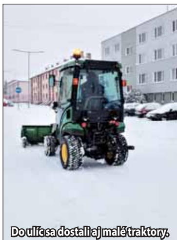
Do ulíc sa dostali aj malé traktory,