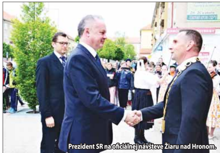
Prezident SR na oficiálnej návšteve Žiaru nad Hronom.

Rok 2016 bol nielen o investičných akciách a rekonštrukciách. V minulom roku naše mesto oslávilo 770. výročie udelenia mestských práv. Počas celého roka sa uskutočnilo viacero podujatí pod záštitou tohto jubilea. Hneď vo februári sme zorganizovali veľkolepé oslavy na Svätokrížskom námestí, ktorými sme sa symbolicky prihlásili k histórii mestečka Svätý Kríž, na ktorého základoch bol vybudovaný Žiar nad Hronom. V dnešnej dobe globalizácie je mimoriadne potrebné starať sa o svoje tradície a odkrývať vlastné korene. Pre Žiar nad Hronom, moderné mesto, ktoré expandovalo kvôli spusteniu výroby hliníka pred viac ako 60 rokmi, je to ešte dôležitejšie. Aby mladá generácia vedela, že naše mesto nie sú len paneláky, ale