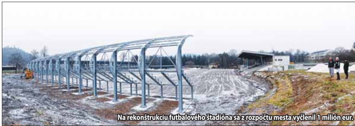
Na rekonštrukciu futbalového štadióna sa z rozpočtu mesta vyčlenil 1 milión eur.

že kedysi to bolo administratívne sídlo bystrickej diecézy a obchodné centrum regiónu. Že sa u nás križovali všetky dôležité cesty a naša história je bohatá na udalosti. Aj z tohto dôvodu, oživovať zabudnutú históriu Svätého Kríža, sme zriadili Svätokrížsky dom. V roku 2016 v ňom bola zrekonštruovaná hospodárka časť a v tomto roku sa chystáme renovovať obytnú časť. Výsledkom by mal byť dom, zariadený v duchu 19. storočia, ktorý názorne pripomína, ako sa u nás žilo takmer pred 200 rokmi.