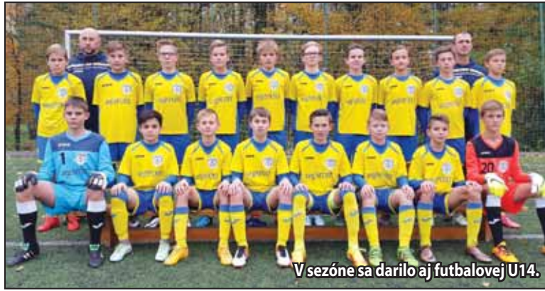
V sezóne sa darilo aj futbalovej U14.

Vyzdvihol by som hlavne prácu všetkých trénerov a ich realizačných tímov, ktorá nám postupne začína prinášať ovocie a verím, že spoločne vychováme ešte veľa hráčov, ktorí sa uplatnia v našom A-tíme alebo nám budú robiť radosť