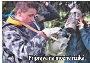
Príprava na možné riziká.

Súťaž je určená pre základné školy, osemročné gymnáziá a centrá voľného času. Cieľom podujatia je prostredníctvom súťaží družstiev pripraviť žiakov na možné riziká, ktoré vyplývajú napríklad z pôsobenia živelných pohrôm, havárií či rôznych katastrof. Žiaci si tak zároveň overia a precvičia svoje vedomosti, ktoré získali v rámci civilnej ochrany obyvateľstva, posky-