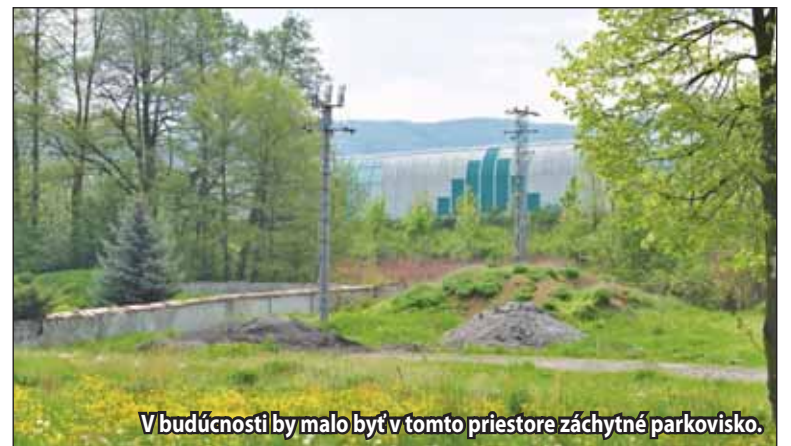
V budúcnosti by malo byť v tomto priestore záchytné parkovisko.

Na parcele pri vstupe do Parku Štefana Moyses z Ulice SNP sa nachádza skládka kamienka a zeminy. Keďže mesto chce zrekultivovať aj vstup do parku, vyzvalo pôvodcu skládky, aby ju do stanoveného termínu odstránil. „Nie je prijateľné, aby sa do parku vchádzalo cez smetisko. Následne po odstránení skládky sa