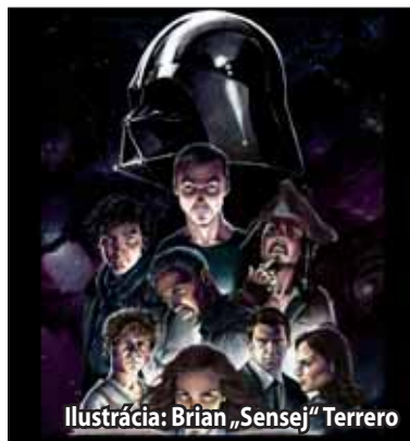
Ilustrácia: Brian „Sensej“ Terrero

Festival sa uskutoční počas dvoch dní, a to v sobotu 25. júna a v nedeľu 26. júna. „Súbežne pôjdu počas dňa prednášky v dvoch miestnostiach, na výber tak bude z približne tridsiatky prednášok. Okrem toho nebudú chýbať odborné workshopy, napríklad so spisovateľmi, úspešným komiksovým ilustrátorom, ale aj s majiteľom žiarskej čajovne. Každý prednášajúci príde s vlastnou