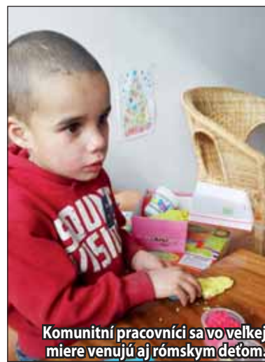
Komunitní pracovníci sa vo veľkej miere venujú aj rómskym deťom.

Priestory komunitného centra sa nachádzajú na Ulici M. Chrásteka, v budove tzv. Jadranov. V súčasnosti v ňom pracujú traja ľudia – odborný garant, odborný pracovník a pracovník.