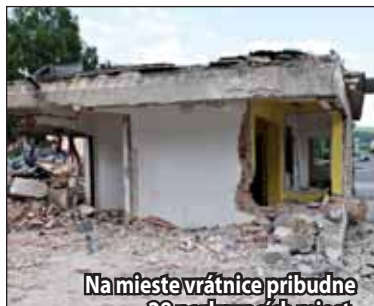
Na mieste vrátnice pribudne 28 parkovacích miest.