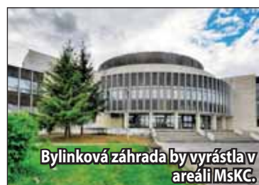
Bylinková záhrada by vyrástla v areáli MsKC.