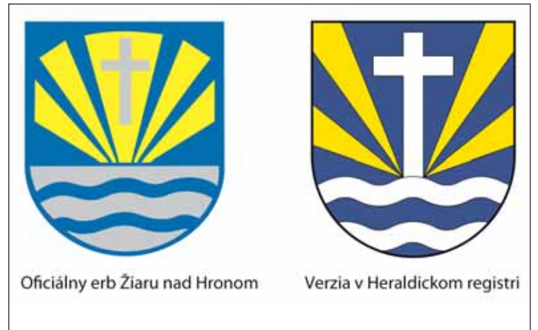
Oficiálny erb Žiaru nad Hronom