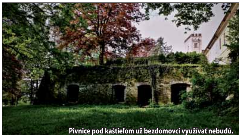
Pivnice pod kaštieľom už bezdomovci využívať nebudú.