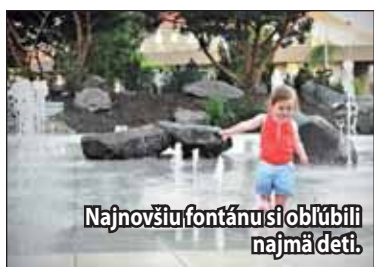
Najnovšiu fontánu si obľúbili najmä deti.