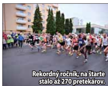
Rekordný ročník, na štarte stálo až 270 pretekárov.