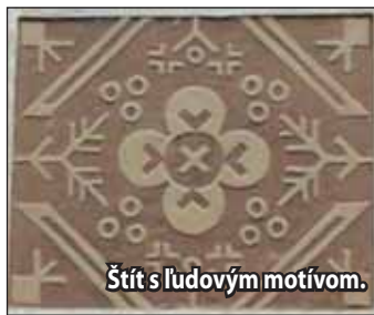
Štít s ľudovým motívom.

Ako sme v minulom čísle informovali, stála tu budova krížskeho mlyna, o ktorom vybudovaní sa hovorilo už pri zakladaní mesta. Jeho základy sú bezpochyby stredoveké. Budova, ktorá na tomto mieste stála, spolu s ďalšími budovami tvorila určité hospodárske zázemie mesta. Stála tu aj pila, ktorá