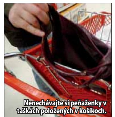
Nenechávajte si peňaženky v taškách položených v košíkoch.

Vreckoví zlodeji využívajú najmä situácie, kde sa zdržiava väčší počet ľudí, pretože sa spoliehajú na anonymitu. Skúsený vreckár vie kabelku prehľadať za pár sekúnd. Preto si počas nákupov nenechávajú svoje peňaženky v kabelkách položených v nákupných