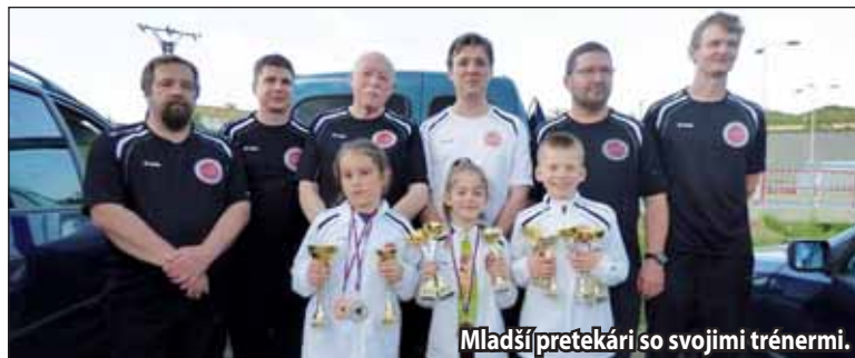
Mladší pretekári so svojimi trénermi.