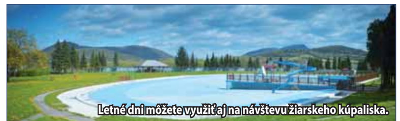
Letné dni môžete využiť aj na návštevu žiarskeho kúpaliska.