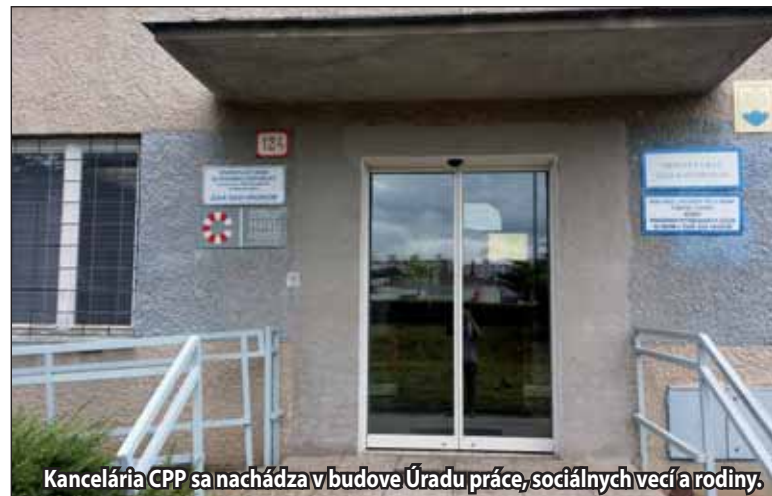
Kancelária CPP sa nachádza v budove Úradu práce, sociálnych vecí a rodiny.

Prvoradým cieľom práce zamestnancov centra je pomoc ľuďom často v ťažkých životných situáciách pri riešení ich právnych problémov. Po ročnom pôsobení v žiarskom regióne je možné konštatovať, že i keď sa pracovníkom podarilo pomôcť mnohým občanom, je tu stále veľké množstvo ľudí, ktorí pomoc potrebujú. Títo ľudia sa môžu obrátiť na centrum osobne, prípadne telefonicky na telefónnom čísle: 045/242 00 21, alebo prostredníctvom e-mailu na adresu: info.zh@centrumpravnejpomoci.sk. (r)