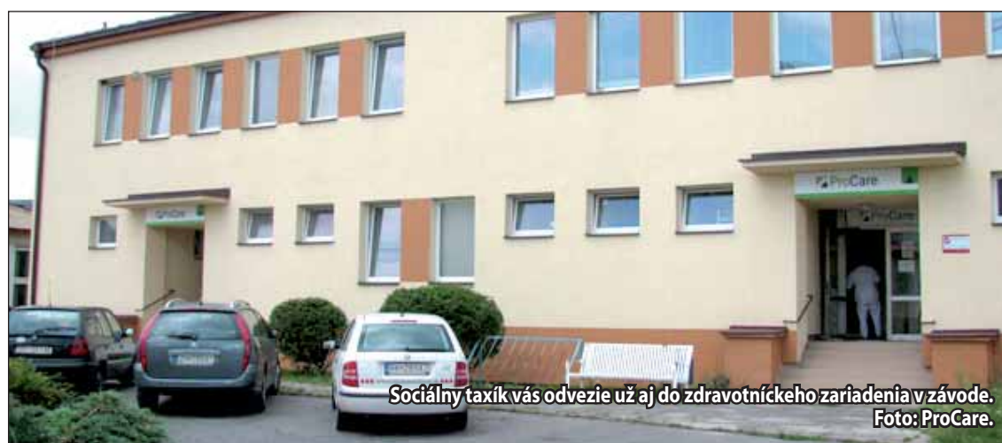
Sociálny taxík vás odvezie už aj do zdravotníckeho zariadenia v závode.

Na taxislužby platia telefónne čísla: 0907 270 750 (p. Šipkovský) a 0907 250 316 (p. Kicko). (li)