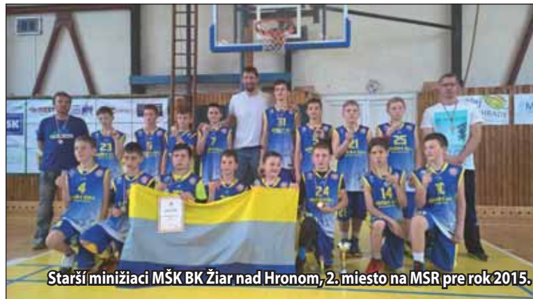
Starší minižiaci MŠK BK Žiar nad Hronom, 2. miesto na MSR pre rok 2015.