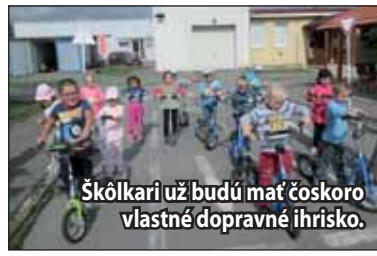
Škôlkari už budú mať čoskoro vlastné dopravné ihrisko.