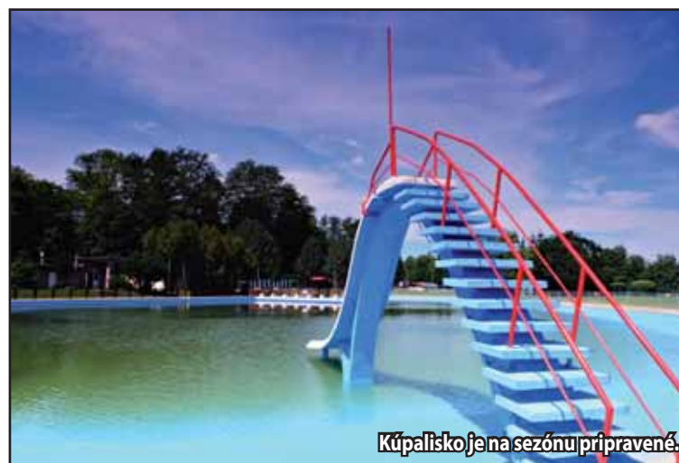
Kúpalisko je na sezónu pripravené.