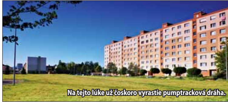
Na tejto lúke už čoskoro vyrastie pumptracková dráha.