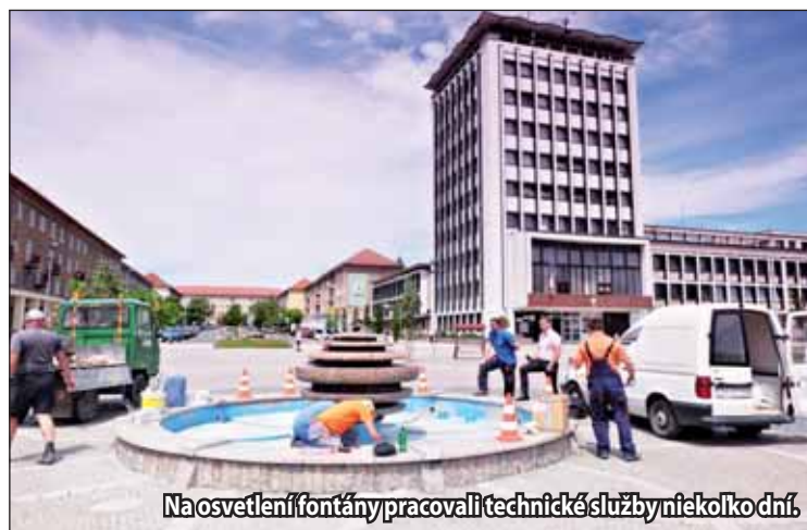
Na osvetlení fontány pracovali technické služby niekoľko dní.

Aj keď pavilón bude slúžiť na oddychovú zónu, samotná drevená konštrukcia sa nebude presúvať ani po letnej sezóne. Využívať sa bude celoročne, napríklad na akcie ako sú vianočné trhy a mesto sa zaoberá myšlienkou umožniť v pavilóne aj organizovanie akcií menšieho charakteru ako sú burzy alebo happeningy. V pavilóne sa počítajú s výpožičkou časopisov či kníh a so zdrojom pitnej vody, ktorú si budú môcť návštevníci nábrať do pohárov. Na túto oddychovú zónu bude po celý deň dohliadať správca. Výstavba vyjde mesto na približne 50 – 60-tisíc eur, investíciu vo výške 20-tisíc eur poskytla Nadácia ZSNP a Slovalco. Práce na výstavbe budú realizovať mestské Technické služby. (li)