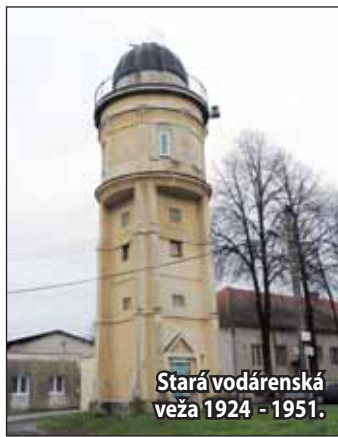
Stará vodárenská veža 1924 - 1951.

V meste v dávnych dobách bolo približne 25 studní kopaných do hĺbky asi 30 m, kde už narazili na vodu. Avšak znečistenie takejto vody bolo časté, a to z dôvodu blízkosti hospodárskych stavieb, hnojísk