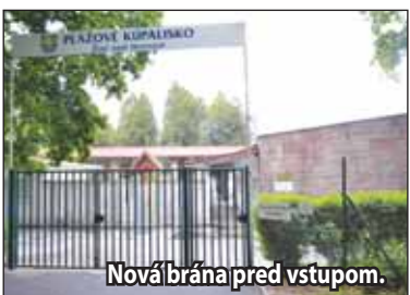
Nová brána pred vstupom.