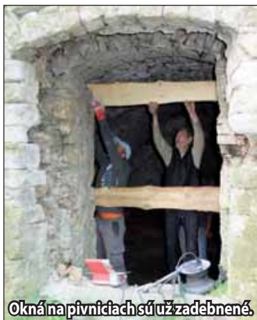
Okná na pivniciach sú už zadebnené.