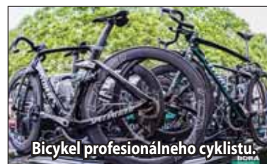
Bicykel profesionálneho cyklistu.