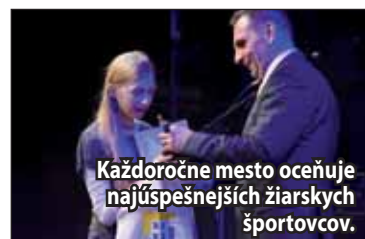
Každoročne mesto oceňuje najúspešnejších žiarskych športovcov.

Hlavnou úlohou a poslaním MŠK je podpora športu v meste, zabezpečovanie finančných prostriedkov pre jednotlivé športové kluby v majstrovských súťažiach a zároveň zabezpečenie realizácie profesionálnej a amatérskej športovej činnosti v plnom rozsahu kolektívnych, individuálnych a masových športoch. Mestský športový klub v Žiari nad Hronom v súčasnosti zastrešuje 17 klubov: Jiu Jitsu, Basketbalový klub, Karate klub, Kulturistický klub, Plavecký klub Delfín,