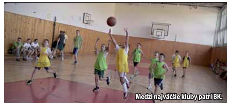
Medzi najväčšie kluby patrí BK.

Klubové príspevky si každý klub stanoví sám a členské príspevky sú 12 eur ročne. Na základe členského preukazu majú členovia zľavu na plavárni a na kúpalisku.