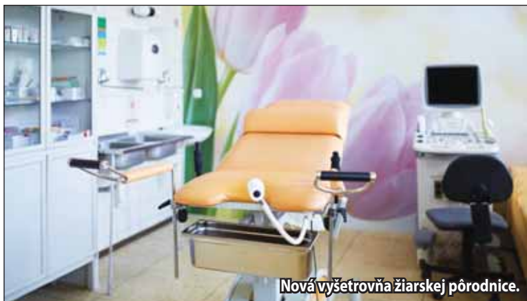
Nová vyšetrovňa žiarskej pôrodnice.

Novinkou je aj individuálny pôrodný plán, ktorý pomáha budúcej mamičke naplánovať si s pôrodnou asistentkou nemocnice jednotlivé časti pôrodu, vyjadriť svoje predstavy a očakávania. Tento jej pôrodný plán je zhmotnený do papierovej brožúry, ktorá dohodnuté predstavy zaeviduje a podľa nich sa orientuje aj zvyšný personál oddelenia. Samozrejme, ak to dovoľujú aktuálne zdravotné okolnosti. Cieľom tohto pôrodného plánu je v prvom rade skvalitniť komunikáciu medzi oddelením a budúcou mamičkou. „Teším sa, že sa nám podarilo v tomto roku zrekonštruovať gynekologicko-pôrodnické oddelenie našej nemocnice, aj vzhľadom na stále rastúci sa počet pôrodov v našej nemocnici a aj