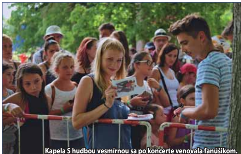
Kapela S hudbou vesmírnou sa po koncerte venovala fanúšikom.