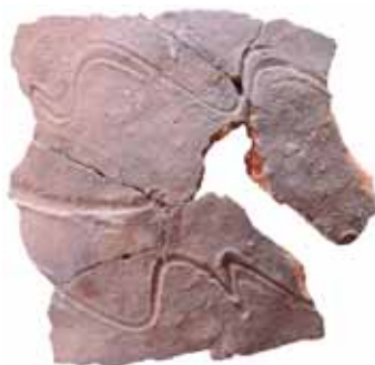
Črepzoslovanskej nádoby, 9.-10. storočie. Nález z parku v Žiari nad Hronom.

Nielen spomienkami pamätníkov, ale aj štúdiom prameňov a neustálym bádaním tak v oblasti písomníctva, ako aj v oblasti materiálnych dokladov. Preto spojením všetkých znalostí pomaly sa vynárajúcich z dávnych časov zabudnutia sa história nášho mesta obohatí a prinesie sumu