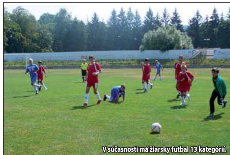
V súčasnosti má žiarsky futbal 13 kategórií.

Chceli by sme posunúť obidva dorasty smerom k špičke druhej ligy a zvíťaziť v 2. lige skupiny JUH v kategórii U15. To by mali byť naše primárne ciele. Samozrejme, potešili by aj popredné miesta ostatných kategórií vo svojich súťažiach a naďalej dobrá práca v nižších poschodiach našej mládežníckej vetvy v prípravkách. (li)