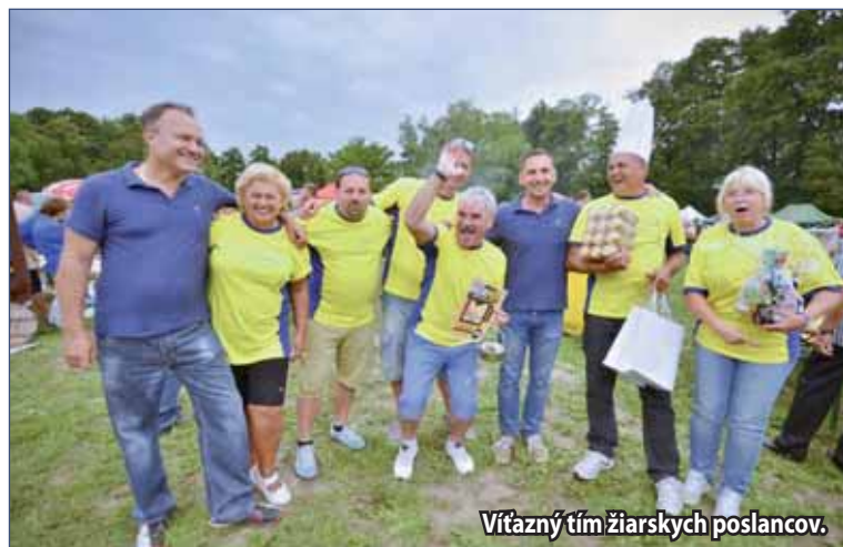
Víťazný tím žiarskych poslancov.

Okrem súťaženia a koštovky dobrých pív sa mohli Žiarčania zabaviť aj pri dobrej hudbe. V rámci sprievodného programu zaspievali speváci z Mužskej