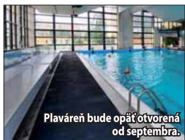
Plaváreň bude opäť otvorená od septembra.