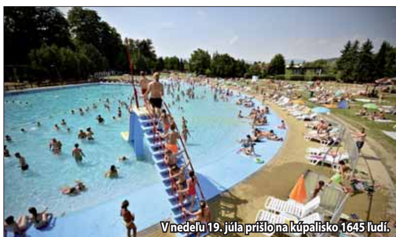
V nedeľu 19. júla prišlo na kúpalisko 1645 ľudí.