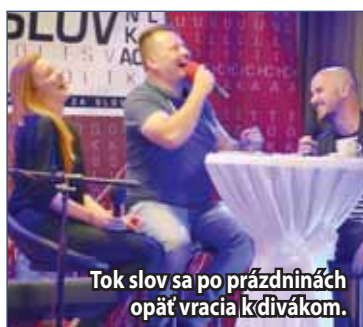
Tok slov sa po prázdninách opäť vracia k divákovi.

Samozrejme, že v súčasnosti sa už naplno venujeme aj príprave Žiarskeho jarmoku, konkrétne pódiovému programu. Kompletný program ešte nie je hotový, ale už môžeme prezradiť, že do Žiaru vrátíme obľúbenú skupinu Ploštín punk a jedným z vrcholov večera bude určite aj koncert skupiny Hrdza. Nebudú chýbať ani domáce hudobné skupiny. (II)