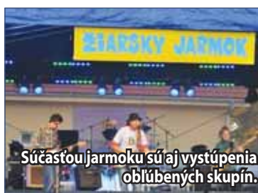
Súčasťou jarmoku sú aj vystúpenia obľúbených skupín.

Blíži sa Žiarsky jarmok, kde majú vždy svoje zastúpenie aj hudobné vystúpenia. Kto bude tento rok zabávať návštevníkov jarmoku?