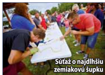
Súťaž o najdlhšiu zemiakovú šupku