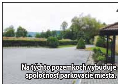
Na týchto pozemkoch vybuduje spoločnosť parkovacie miesta.

Vo štvrtok 11. augusta sa uskutočnilo mimoriadne zasadnutie MsZ v Žiari nad Hronom. Zúčastnilo sa ho 16 poslancov. Poslanci na ňom schválili odpredaj pozemkov pre dve spoločnosti.