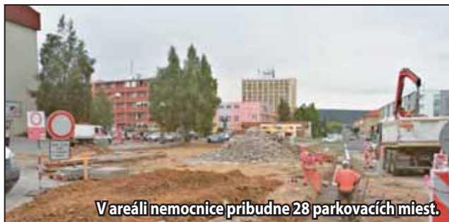
V areáli nemocnice pribudne 28 parkovacích miest.

Žiarska nemocnica mohla v máji pristúpiť k zahájeniu prác, ktorých výsledkom majú byť nové parkovacie plochy v jej areáli. „Prvým krokom bolo zbúranie pôvodnej budovy vrátnice pri hlavnom vstupe,“ informuje hovorca spoločnosti Svet zdravia Tomáš Král a ako ďalej konkretizuje, už počas júla sa pristúpilo aj k samotnej rekonštrukcii parkovacích plôch a príľahlej cestnej infraštruktúry a chodníkov. Koncom septembra by malo pred budovou polikliniky pribudnúť celkovo 28 nových parkovacích