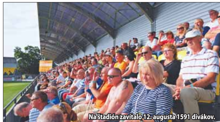
Na štadión zavítalo 12. augusta 1591 divákov.