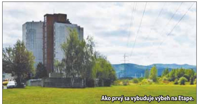
Ako prvý sa vybuduje výbeh na Etape.