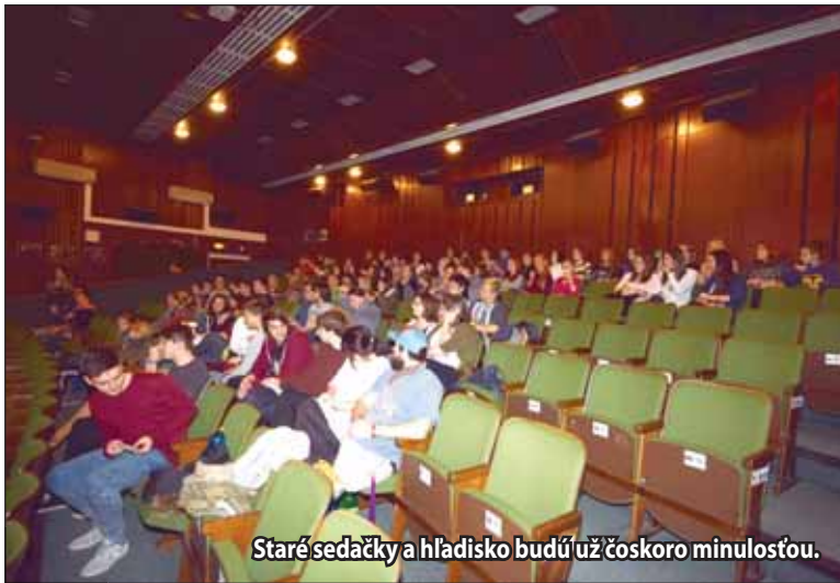
Staré sedačky a hľadisko budú už čoskoro minulosťou.

„Do hľadiska sa umiestnia dva druhy sedadiel,“ približuje riaditeľka žiarskeho