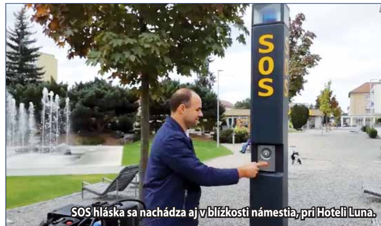
SOS hláska sa nachádza aj v blízkosti námestia, pri Hoteli Luna.