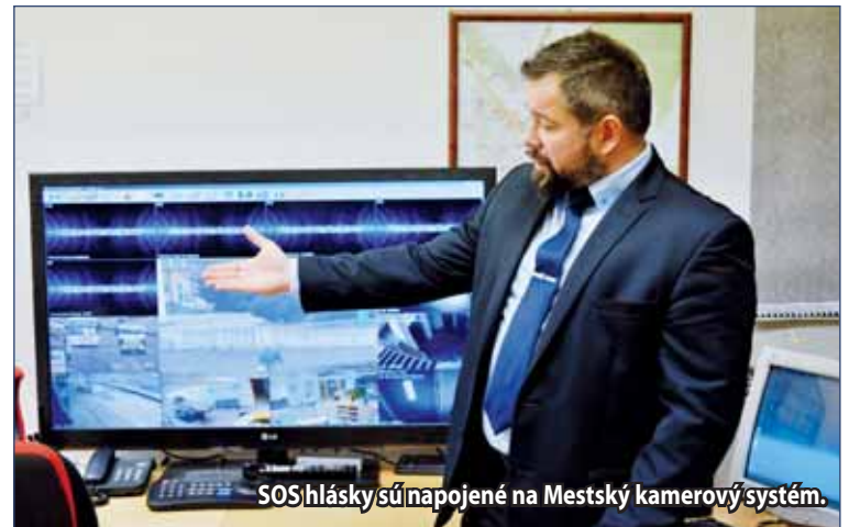
SOS hlásky sú napojené na Mestský kamerový systém.

Tiesňové hlásky sa na území Žiaru nad Hronom nachádzajú v siedmich lokalitách. Pri ich výbere sa pritom vychádzalo z dlhodobu sledovaných štatistík. Do úvahy sa bralo napríklad aj to, aký je pohyb obyvateľov v danej lokalite. „Typickým miestom je Centrálna autobusová stanica, kde sa premieľajú obrovské množstvo ľudí. Mládež nám často cez stanicu chodí do starej časti mesta, kde sa nachádzajú rôzne zábavné podniky a práve v tejto lokalite dlhodobo zaznamenávame zvýšený výskyt krádeží na osobách a lúpežných prepadnutí. Autobusová stanica bola preto jedno z prvých vytipovaných miest. Ďalším miestom je Park Štefana Moysesa, do ktorého dnes ľudia chodia za oddychom.