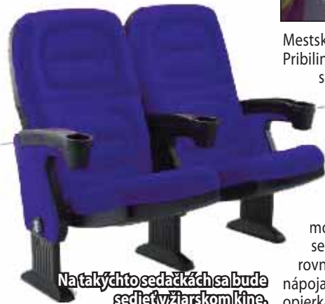
Natákytýchto sedačkách sa bude sedieť v žiarskom kine.

Digitalizáciu Kina Hron finančne podporil Audiovizuálny fond.