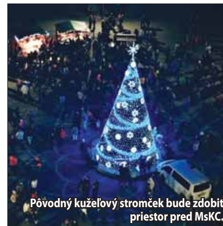
Pôvodný kuželový stromček bude zdobiť priestor pred MsKC.