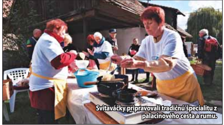
Svitaváčky pripravovali tradičnú špecialitu z palacinkového cesta a rumu.

Od obnovenia jarmoku v našom meste sa jarmok spája s druhým októbrovým týždňom. Napriek tomu v poslednom období pribúda názorov, že je vzhľadom na termín výplat priskoro. Prípadne