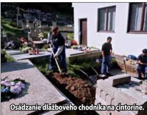
Osádzanie dlažbového chodníka na cintoríne.