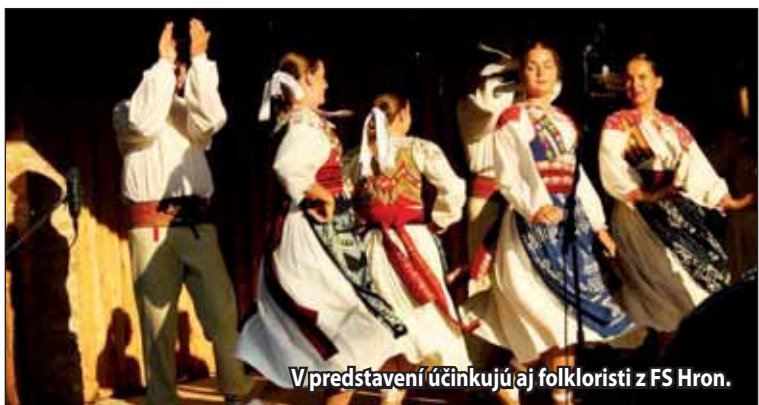
V predstavení účinkujú aj folkloristi z FS Hron.

S FINANČNOU PODPOROU BANSKOBYSTRICKÉHO SAMOSPRÁVNÉHO KRAJA