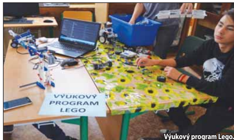
Výukový program Lego.