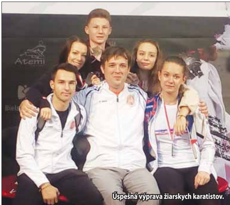
Úspešná výprava žiarskych karatistov.

Sezóna sa pre karatistov z MŠK Žiar nad Hronom začala hneď z ostra. Prvým turnajom, kde sa zúčastnili členovia klubu, bol výjazd reprezentácie Slovenska 10. septembra do chorvátskeho mesta Zagreb.