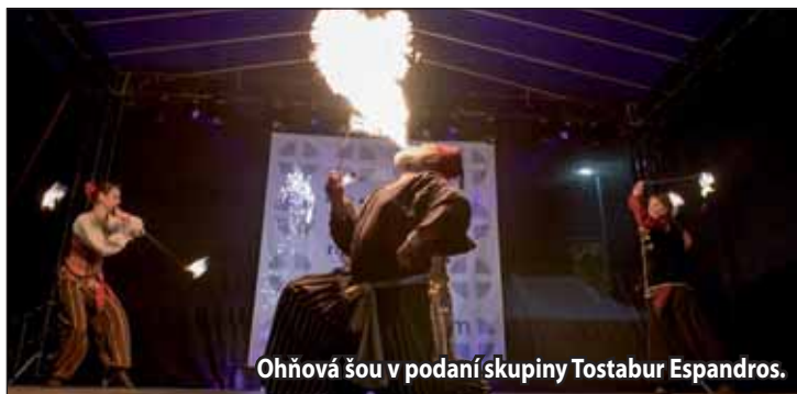
Ohňová šou v podaní skupiny Tostabur Espandros.