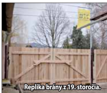
Replika brány z 19. storočia.

Svätokrižsky dom slúži na organizovanie rôznych menších kultúrnych podujatí folklórneho zamerania, zachovávanie tradícií a histórie nášho mesta. Po prvýkrát