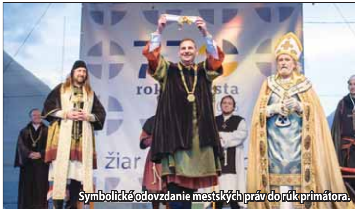
Symbolické odovzdanie mestských práv do rúk primátora.