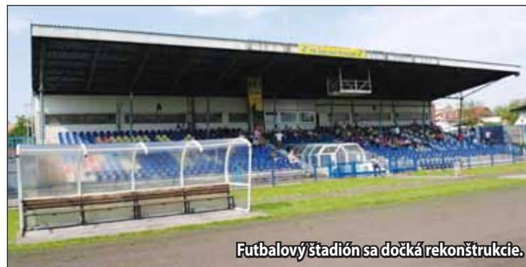
Futbalový štadión sa dočká rekonštrukcie.