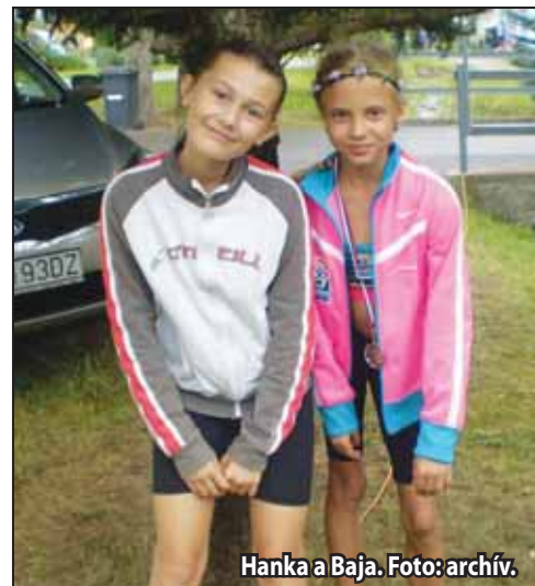
Hanka a Baja.

Popri majstrovstvách sa konal aj medzinárodný míting, kde nastúpil na trať 1500 m Lukáš Muha. V konkurencii 16 mužov z európskych štátov sa umiestnil na 14. mieste s osobným časom 4:12,70. (ap)