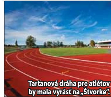
Tartanová dráha pre atléty by mala vyrásť na „Štvorke“.