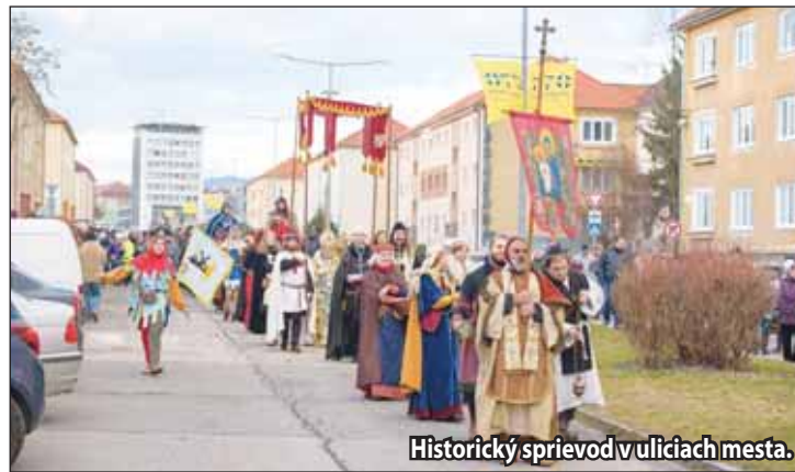
Historický sprievod v uliciach mesta.