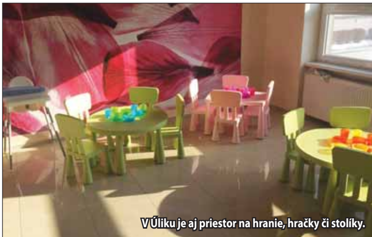
V Úliku je aj priestor na hranie, hračky či stolíky.

Mestské materské centrum Úlik oficiálne otvárame už 15. februára. Mamičkám bude k dispozícii štyri dni v týždni.