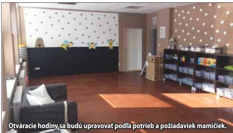
Otváracie hodiny sa budú upravovať podľa potrieb a požiadaviek mamičiek.