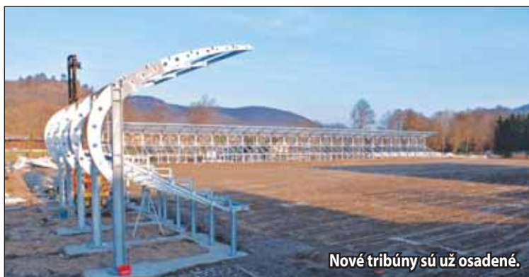
Nové tribúny sú už osadené.

Rekonštrukciou prejde aj budova, ktorú doposiaľ verejnosť nemala veľmi možnosť využívať. „Hlavná tribúna je v prvom rade určená ako účelové zariadenie pre futbal. To sa ani po rekonštrukcii nezmení. Budú v nej mať zázemie hráči, médiá, VIP návštevníci a tzv. funkcionári. To ale platí len počas majstrovských domácich zápasov, ktoré bývajú zvyčajne