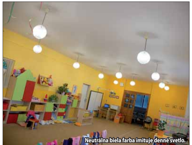
Neutrálna biela farba imituje denné svetlo.