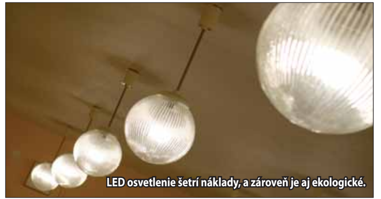
LED osvetlenie šetrí náklady, a zároveň je aj ekologické.