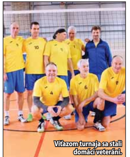
Víťazom turnaja sa stali domáci veteráni.