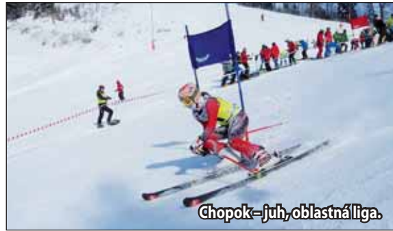
Chopok – juh, oblastná liga.

februára, kedy na Martinských v jej kategórii, ktorým sa podarilo získať pódiové umiestnenie vo všetkých absolútnych pretekoch. Po piatom kole Slovenského pohára má tretí najvyšší počet sumárnych bodov – 245. (li)