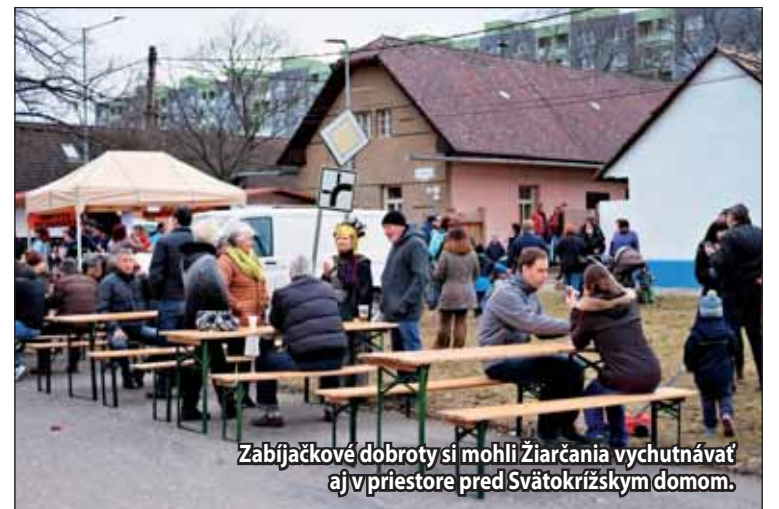
Zabijačkové dobroty si mohli Žiarčania vychutnávať aj v priestore pred Svätokrížskym domom.

KULTÚRNA UDALOSŤ ROKA! JAROMÍR NOHAVICA PREMIÉROVO V ŽIARI!