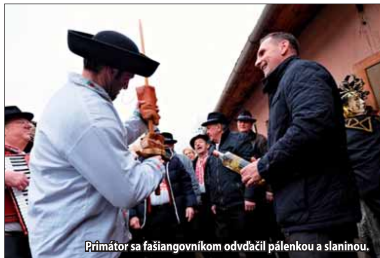
Primátor sa fašiangovníkom odovdčal pálenkou a slaninou.