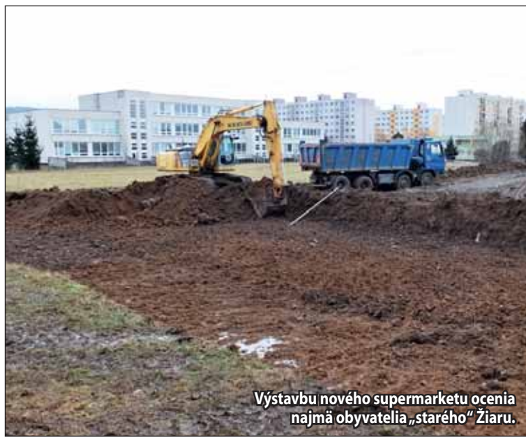
Výstavbu nového supermarketu ocenia najmä obyvatelia „starého“ Žiaru.

Niektorí Žiarčania majú na výstavbu ďalšieho supermarketu v meste negatívne názory. „Pozemok, na ktorom spoločnosť stavia supermarket, nepatrí nikdy mestu. O tom, čo tam bude,