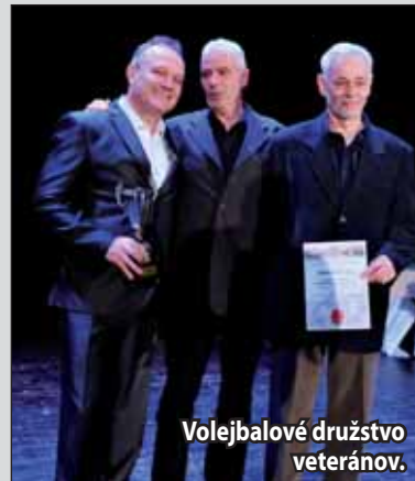
Volejbalové družstvo veteránov.

ČSSR stredoškolskej mládeže v behu na 100 m, 200 m a v skoku do diaľky. Bol v širšom výbere juniorskej reprezentácie ČSSR v behu na 100 m.