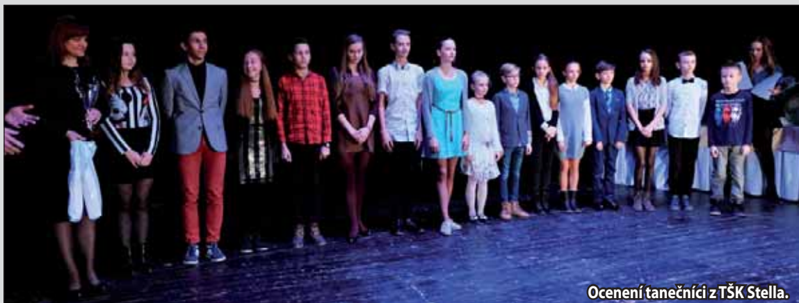
Ocenení tanečníci z TŠK Stella.