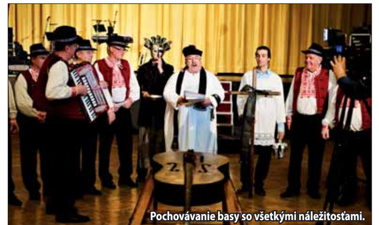
Pochovávanie basy so všetkými náležitosťami.

Fašiangy v Žiari vyvrcholili popoludní, a to Fašiangovou veselnicou v Hlavnej sále Mestského kultúrneho centra. Nechýbalo tradičné pochovávanie basy, ktorým sa symbolicky ukončilo obdobie plesov a zábavy a nastalo tak obdobie pôstu, ktoré potrvá až do Veľkej noci. „Verím, že ľuďom sa podujatie páčilo a že privítali zase niečo nové, čo sme pre nich v Svätokrížskom dome pripravili,“ uzavrel