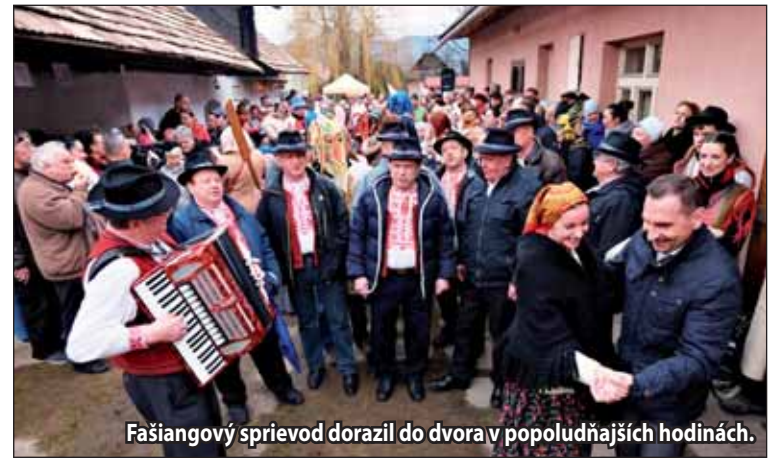
Fašiangový sprievod dorazil do dvora v popoludňajších hodinách.

Svätokrížsky dvor sa návštevníkmi i okoloidúcimi zvedavcami zaplnil postupne od rána, najviac ľudí však začalo chodiť okolo obeda. Okrem zabijačkových špecialít mohli ochutnať aj lahodnú medovinu či iné teplé alebo studené nápoje, ktoré sa predávali v priestoroch pred Svätokrížskym domom. Takmer ani jedno voľné miesto vo dvore by ste však nenašli popoludní, keď do dvora zavítal fašiangový sprievod, na čele s richtárom. Fašiangovníci s veselými a vtipnými maskami vyrazili v sprievode od Mestského kultúrneho centra a prešli celým mestom. Spoločne s veselým sprievodom prišli aj speváci z Mužskej speváckej skupiny Sekera a spevácky súbor zo Šášova. Pálenkou a slaninou ich počastoval primátor mesta a za ich vinšovanie boli odmenení aj sladkými šiškami, ktoré už k fašiangom neodmysliteľne patria.