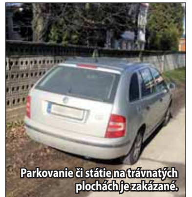
Parkovanie či státie na trávnatých plochách je zakázané.

Je všeobecne známe, že v Žiari nad Hronom je parkovanie zadarmo. Na druhej strane, miest na parkovanie je čím ďalej menej a preto sa Žiarčania domáhajú nových parkovacích miest. „V centre mesta zaparkovať cez deň je nemožné a verím, že áut skôr pribúda ako ubúda. Treba aj vytvárať parkovacie miesta,“ píše na sociál-