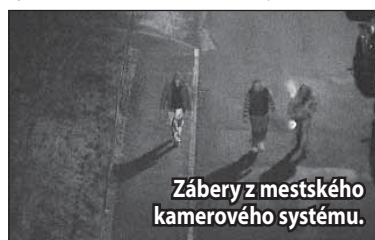
Zábery z mestského kamerového systému.

Polícia v Žiari nad Hronom už začala trestné stíhanie vo veci prečinu ublíženia na zdraví a prečinu výtržníctva. V utorok 15. marca, približne o 21.00 hodine, páchatel fyzicky napadol v pohostinstve na Hviezdoslavovej ulici v Žiari nad Hronom dvoch mužov zo Žiaru nad Hronom,“ informuje krajská policajná hovorkyňa Mária Faltániová a konkretizuje: „23-ročného muža najprv páchatel uderil dvakrát päsťou do tváre a následne ho udieral aj do iných častí tela. Keď mu prišiel na pomoc ďalší muž, páchatel ho kopol do hlavy a následne ho udieral aj do iných častí tela.“ Podľa predbežnej lekárskej správy, mladší Heňo utrpel zranenia s dobou liečenia 7 a viac dní a Miro, starší z napadnutých, utrpel zranenia s dobou liečenia minimálne 20 dní. Prípady sú v štádiu vyšetrovania. Z dôvodu vecnej príslušnosti