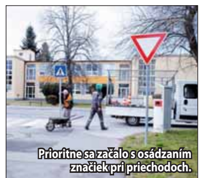
Prioritne sa začalo s osádzaním značiek pri priechodoch.