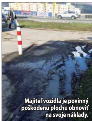
Majiteľ vozidla je povinný poškodenú plochu obnoviť na svoje náklady.

Poškodený trávnik je majiteľ vozidla povinný obnoviť na svoje náklady