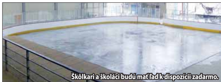
Škôlkari a školáci budú mať ľad k dispozícii zadarmo.