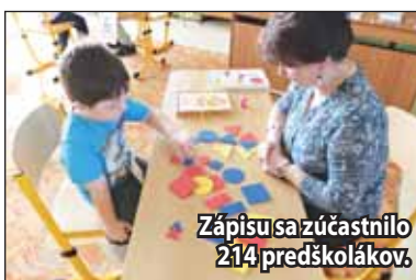
Zápisu sa zúčastnilo 214 predškolákov.