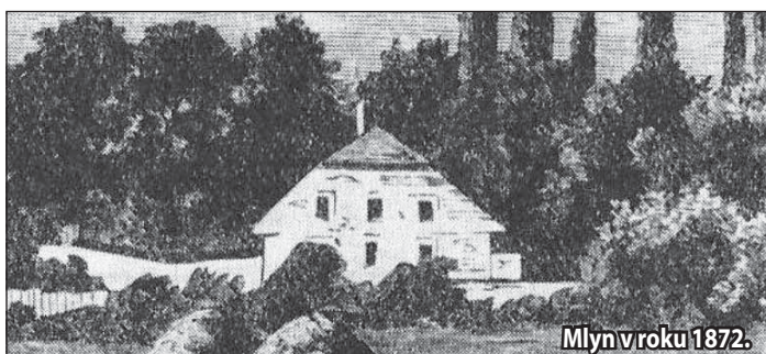
Mlyn v roku 1872.

V tomto čase bolo v Kríži 31 usadlostí (dom s dvorom a hospodárskymi budovami), v ktorých spolu s ľuďmi v kaštieli a na fare a ich služobníkmi žilo v mestečku Kríži približne 400