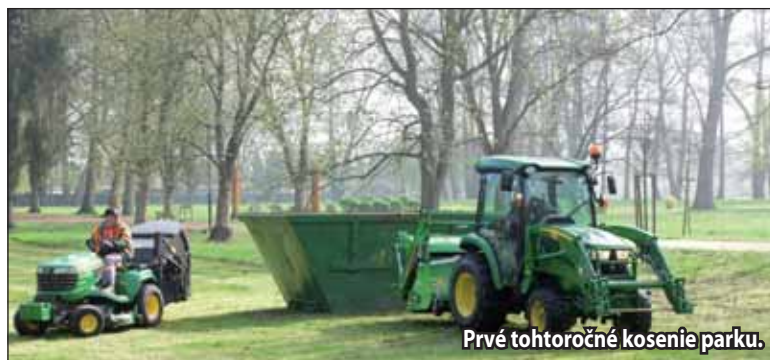
Prvé tohtoročné kosenie parku.