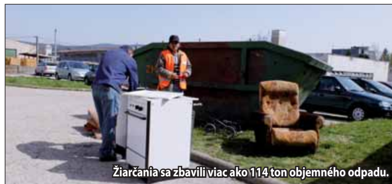
Žiarčania sa zbavili viac ako 114 ton objemného odpadu.

Na sociálnych sieťach sa niekoľko obyvateľov pýtalo, či sú dni čistoty stále potrebné a nemiňajú sa účinku, keďže niektorý odpad aj naďalej končí v rukách neprispôsobivých občanov a neskôr z neho vznikajú tzv. čierne skládky. „Táto povinnosť nám vyplýva zo zákona. Bohužiaľ, každoročne sa na tom prizívajú aj tzv. kárickári. Aktívni pracovníci, ktorí robia asistenciu pri kontajneroch, sú však poučení o tom, že nesmú vyberať odpad z kontajnerov. Pracovníci odboru odpadového hospodárstva robia pravidelne kontrolu stanovišť, ale nie je možné byť všade. Na druhej strane, veľa občanov dáva veci priamo