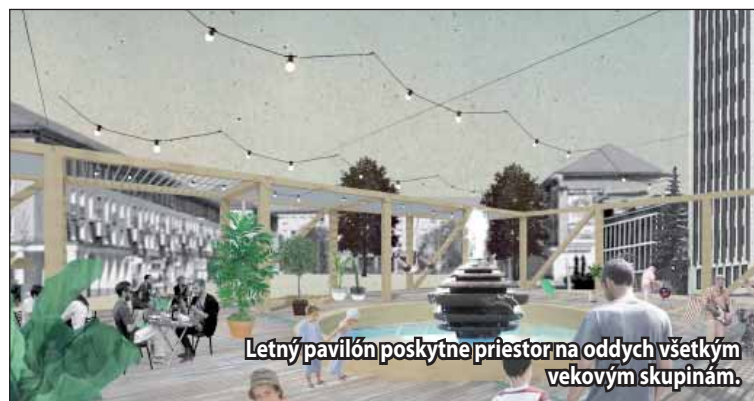
Letný pavilón poskytne priestor na oddych všetkým vekovým skupinám.