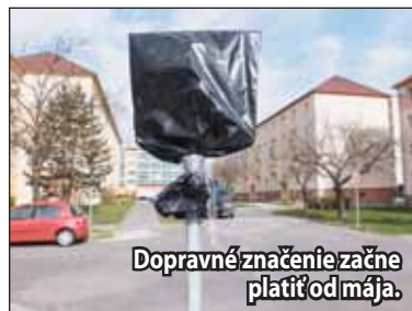
Dopravné značenie začne platiť od mája.

Dopravné značky začnú platiť približne od mája tohto roku potom, ako bude hotové aj vodorovné dopravné značenie. „A to závisí najmä od počasia,“ dodal Baranec. (kr)