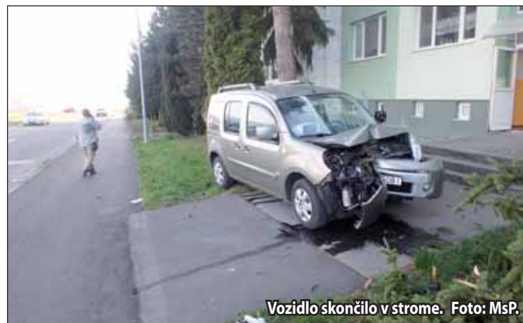
Vozidlo skončilo v strome.

po náraze odpadol vrcholec. Bezprostredná prítomnosť hliadky mestskej polície pomohla promptne zabezpečiť okamžitú kooperáciu všetkých zložiek Integrovaného záchranného systému. Hasiči sanovali vytečené prevádzkové kvapaliny, záchranári sa postarali o zraneného vodiča a dopravný policajt dokumentoval nehodu vozidla, ktoré vyšlo z nehody najhoršie. (r)