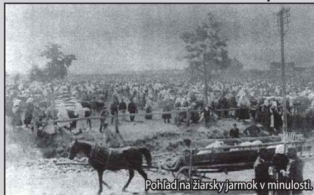
Pohľad na žiarsky jarmok v minulosti.