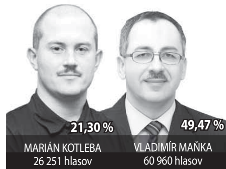
MARIÁN KOTLEBA 26 251 hlasov

Voľby do VÚC sa konali na celom území Slovenska. V ôsmich krajoch je spolu 5932 volebných okrskov, v ktorých je zapísaných 4 463 039 voličov. Odvoliť ich však prišlo iba 897 536, čo predstavuje 20,11 % účasť. Vo všetkých krajoch občania dokopy volili 408