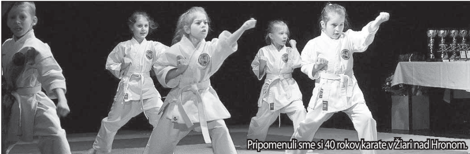
Pripomenuli sme si 40 rokov karate v Žiari nad Hronom.

Karate klub MŠK Žiar nad Hronom sa v roku 2013 stal piatym najlepším karate klubom na Slovensku. V tomto roku sme si pripomenuli už 40 rokov od jeho vzniku.