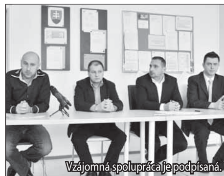
Vzájomná spolupráca je podpísaná.

Iniciatívu FK Pohronie zriadiť futbalovú športovú