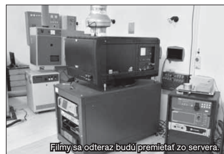
Filmy sa odteraz budú premietat zo servera.

mietacie dni nebudú pravidelné. „Keďže kino sídli v multifunkčnej budove, kde sa konajú aj iné podujatia a predstavenia, aby sa tieto navzájom nerušili. Premietat však budeme minimálne štyri dni v týždni. Dvakrát cez pracovný týždeň a vždy cez víkend, ak to bude možné vzhľadom na iné akcie. Väčšinu dní sa budú premietat dva filmy denne – po 18-tej a po 20-tej hodine, prípadne tri filmy cez víkend, kedy sa budú premietat detské filmy po 16-tej hodine,“ konkretizuje ďalej Lenka Nitrayová. Žiarčania pritom na filmové novinky nebudú musieť čakať. Premiérové filmy sa budú premietat vždy v priebehu siedmich dní od uvedenia novinky a následne v reprízach v ďalších dňoch.