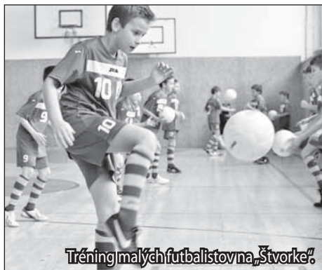
Tréning malých futbalistov na „Štvorku“.