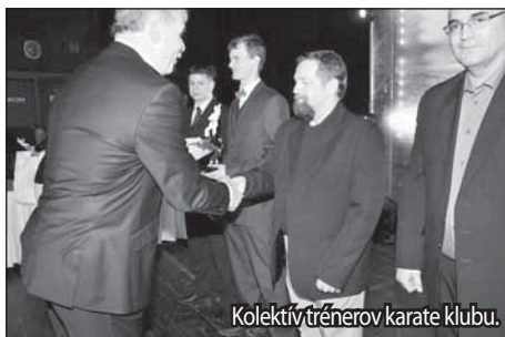
Kolektív trénerov karate klubu.