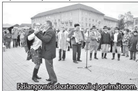
Fašiangovníci si zatancovali aj s primátorom.

Veselý fašiangový sprievod zobrať do tanca každého, koho po ceste mestom stretol. O dobrú náladu sa starali aj domáce folklórne súbory Hron, Sekera, Hroniarik, nechýbala ľudová hudba a o program sa postarali žiaci Základnej umeleckej školy Zity Strnadovej-Parákovvej. Kto zavítal na námestí