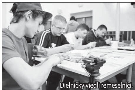
Dielničky viedli remeselníci.

Naše predstavenie nie je vulgárne, ale nie je pre deti. Aj významovo, aj obsahovo, aj tematicky sme sa rozhodli, že od 15 rokov to bude ok. (li)