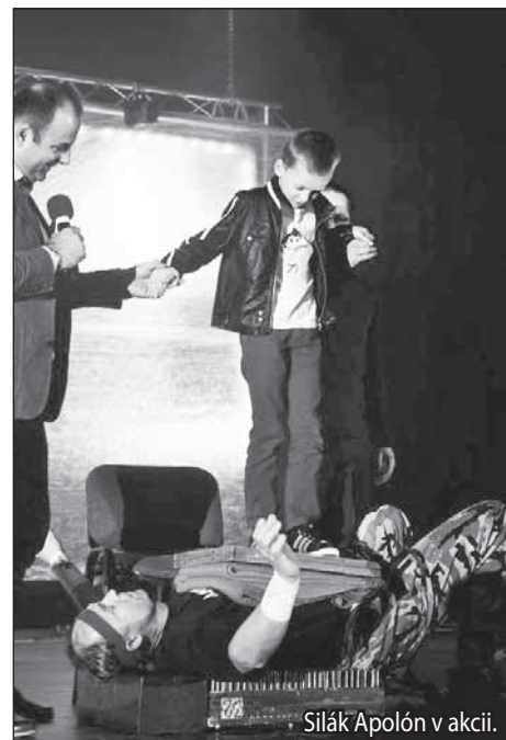
Silák Apolón v akcii.