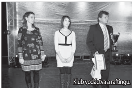
Klub vodčstva a raftingu.