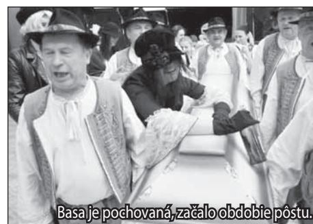
Basa je pochovaná, začalo obdobie pôstu.

Na žiarsku radnicu prišli aj školáci, aby vo fašiangových maskách navštívili a zabavili primátora mesta. Ten ich pohostil sladkými šiškami, ktoré k fašiangu neodmysliteľne patria. (li)