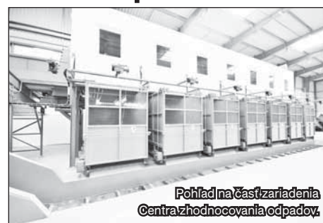
Pohľad na časť zariadenia Centra zhodnocovania odpadov.