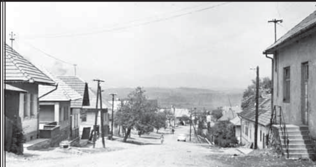
Rok 1948, keď obec prosperovala.

POZÝVAME RODÁKOV, PRIATEĽOV A PRIAZNIVCOV NA SVÄTÚ OMŠU DO KOSTOLA SV. VAVRINCA, KTORÁ BUDE V HORNÝCH OPATOVCIACH V SOBOTU 6. SEPTEMBRA O 10.00 HODINE.