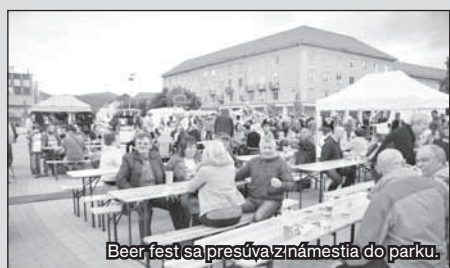
Beer fest sa presúva z námestia do parku.