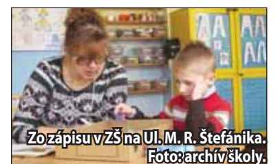
Zo zápisu v ZŠ na Ul. M. R. Štefánika.