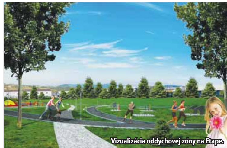
Vizualizácia oddychovej zóny na Etape.

Ako sme vás už niekoľkokrát informovali, po „Hviezdoške“ pribudne tento rok v meste ďalšia oddychová zóna na Etape. Pri príprave projektu sa zohľadňovala potreba zmeny účelu využívania oddychovej zóny na nový účel, a tým bude in-line dráha pre korčuliarov.