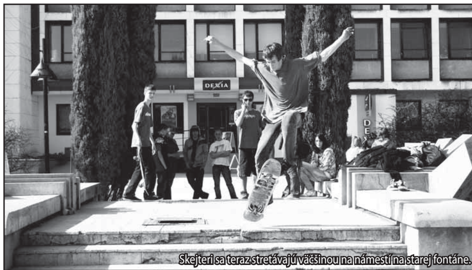
Skejteri sa teraz stretávajú väčšinou na námestí na starej fontáne.