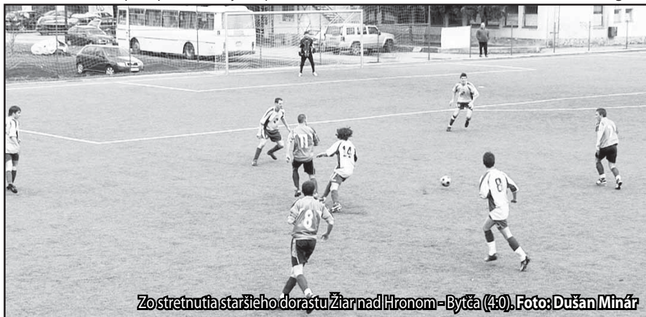
Zo stretnutia staršieho dorastu Žiar nad Hronom - Bytča (4:0).