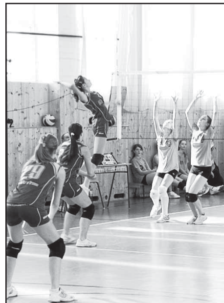
Žiarske staršie žiačky (v popredí) zdolali Banskú Bystricu hladko 3:0 a 3:0.

15. kolo: Žiar nad Hronom B - Hnúšťa II. A 0:2 (-23, -22), Žiar nad Hronom A - Hnúšťa II. B 0:2 (-18, -20), Žiar nad Hronom A - Hnúšťa II. A 0:2 (-11, -13), Žiar nad Hronom B - Hnúšťa II. B 2:0 (11, 17) , dohrávané 9. kolo: Krupina B - Žiar nad Hronom B 0:2 (-17, -23), Krupina A - Žiar nad Hronom A 2:0 (10, 22), Krupina A - Žiar nad Hronom B 0:2 (-15, -18), Krupina B - Žiar nad Hronom A 2:1 (18, -18, 8)