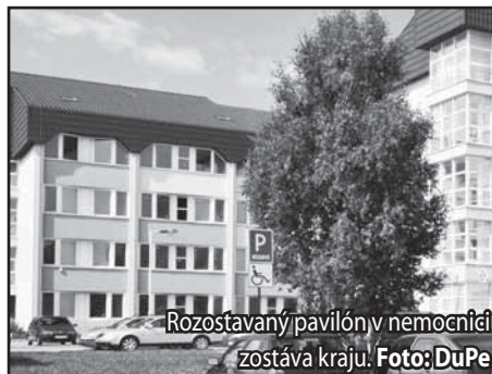
Rozostavaný pavilón v nemocnici zostáva kraju.