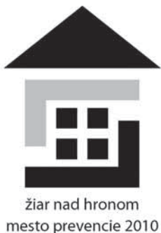
Žiar nad Hronom mesto prevencie 2010

Regionálny úrad verejného zdravotníctva, mesto Žiar nad Hronom, Centrum voľného času a Všeobecná zdravotná poisťovňa pripravili pri príležitosti Svetového dňa zdravia niekoľko akcií. Prevencia – predchádzanie ochoreniam – je najľahšou, a zároveň najzložitejšou úlohou nielen pre jednotlivca, ale aj pre celú spoločnosť. Pokiaľ je človek mladý a všetko funguje tak, ako má, často si nepripúšťa možnosť, že problém srdcového alebo nádorového ochorenia sa môže týkať aj jeho samého. Neuvedomujeme si, že základy zdravotného stavu sa budujú už od detstva. Stravovacie návyky ako aj spôsob života sa často preberajú z generácie na generáciu a veľmi ťažko sa menia. Nevýhodou prevencie je, že jej úspešnosť alebo i neúspešnosť sa odzrkadlí až za niekoľko rokov. Aktívnym prístupom k ochrane svojho zdravia možno v 50 % prípadov predísť riziku vzniku srdcovo-cievnych ochorení. Ak máme dostatok odborných informácií a chuť správať sa podľa nich a vyhnúť sa rizikovým faktorom (neracionálna výživa, zlé stravovacie návyky, málo pohybu, fajčenie, nadmerná konzumácia alkoholu a stres), máme veľkú šancu dočkať sa v zdraví staršieho veku a plne si užívať zaslúžený oddych po rokoch tvrdej práce a povinností.