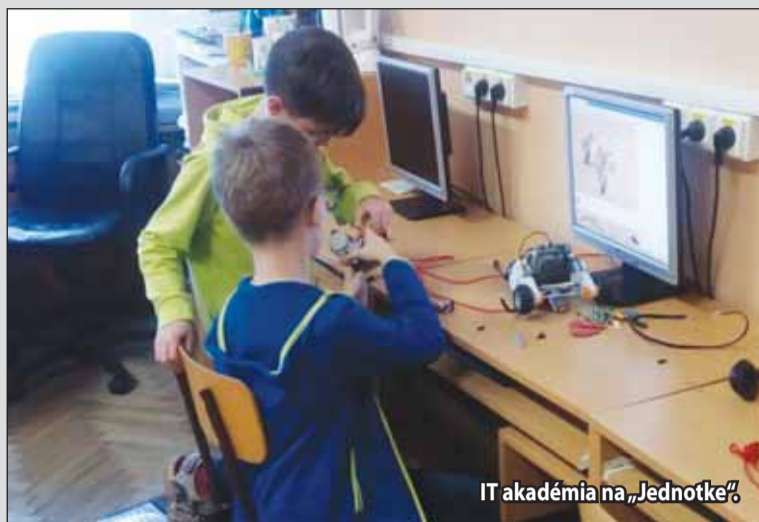
IT akadémia na „Jednotke“

Vďaka projektu V základnej škole úspešnejší získala škola dvoch asistentov učiteľa a ako jediná škola v Žiari nad Hronom aj školského psychológa na plný úväzok. „Za polroka trvania projektu môžeme konštatovať,