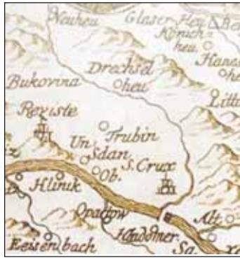
zmieňovaná ako cesta na Prievidzu. Pozrieme sa na ňu bližšie.

Cesty vlastne neprechádzali mestom, viedli len v jeho blízkom okolí a niekedy až úplne popri jeho hradbách. Ale jedna cesta viedla práve stredom mesta a bola hlavnou, takpovediac tepnou mesta. Bola to terajšia Handlovská cesta, v minulosti