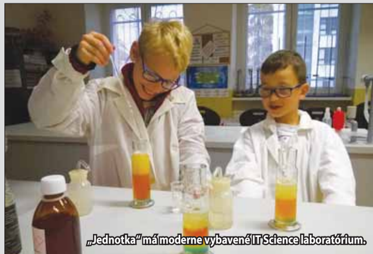
„Jednotka“ má moderne vybavené IT Science laboratórium.

nadania a orientácia na zdravý životný štýl, ktorá ide v intenciách dnešnej doby, osloví naozaj každého nášho zverenca,“ uzatvára riaditeľka žiarskej „Štvorky“.