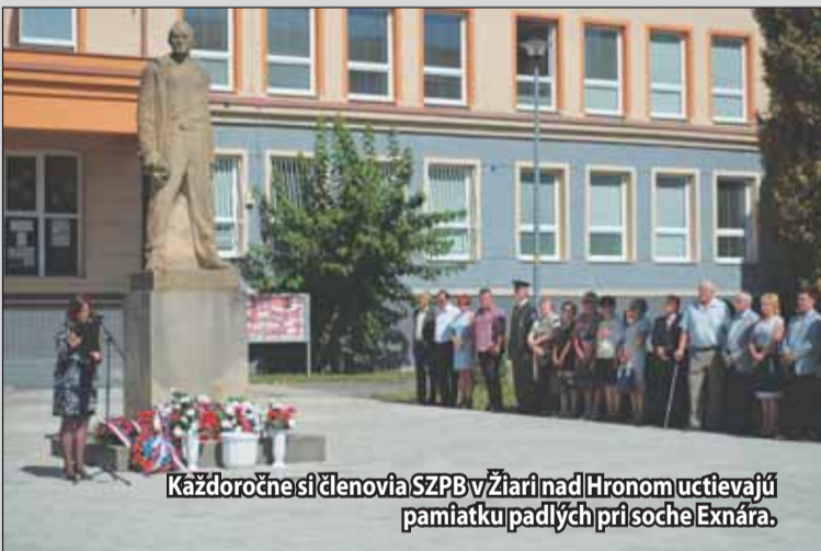
Každoročne si členovia SZPB v Žiari nad Hronom uctievajú pamiatku padlých pri soche Exnára.

29. august je oprávnené štátnym sviatkom Slovenskej republiky. Hlavným kritériom hodnotenia významu Slovenského národného povstania musí byť fakt, že slovenský národ sa dokázal so zbraňou v ruke postaviť proti okupácii svojho historického územia, a to napriek neistému výsledku.