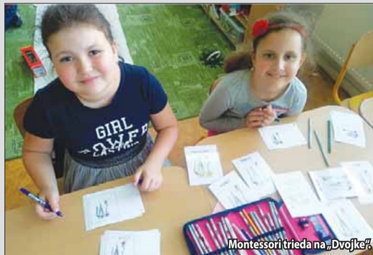
Montessori trieda na „Dvojke“