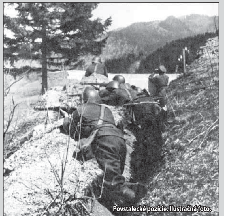
Povstalecké pozície. Ilustračná foto.