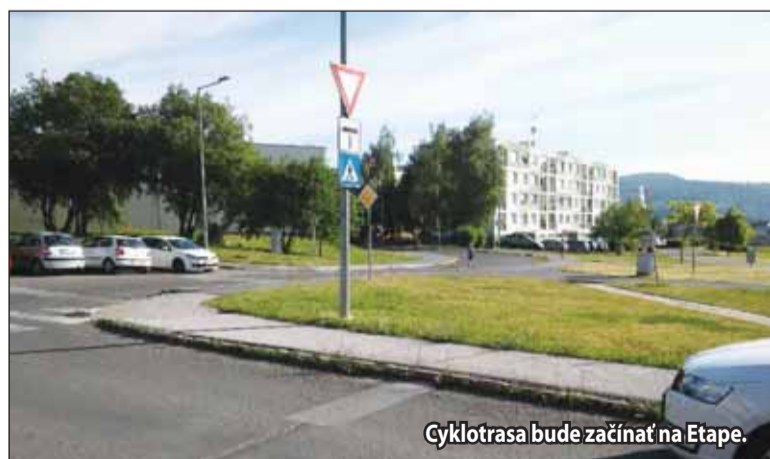
Cyklotrasa bude začínať na Etape.

Samotná výstavba cyklotrasy pozostáva z piatich samostatných stavebných objektov. Nimi sú napríklad cyklotrasa vedená po uliciach SNP, Jilemnického, Bernolákova, Svitavská, Š. Moyses, Námestie Matice slovenskej, Hutníkov až po lávku ponad riekou Hron. Súčasťou projektu by malo byť aj osvetlenie pri prechodoch pre chodcov a cyklistov krížiacich frekventované miestne komunikácie.