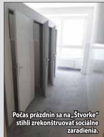
Počas prázdnin sa na „Štvorke“ stihli zrekonštruovať sociálne zariadenia.