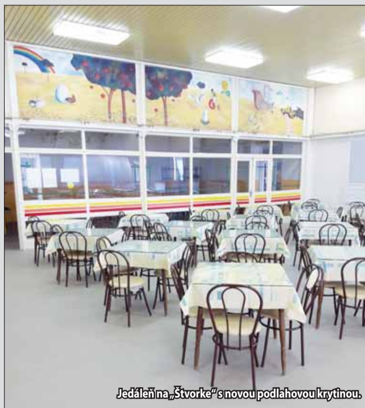
Jedáleň na „Štvorke“ s novou podlahovou krytinou.