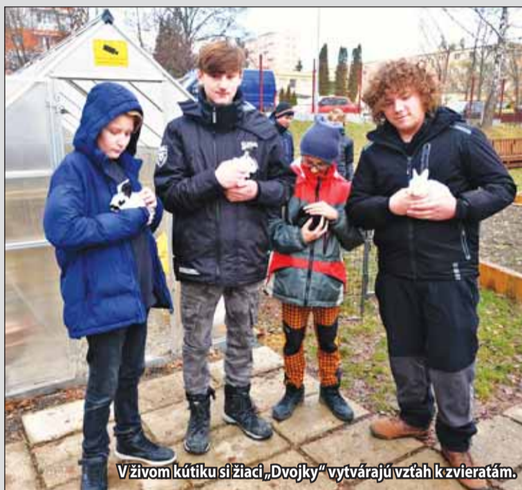
V živom kútiku si žiaci „Dvojky“ vytvárajú vzťah k zvieratám.