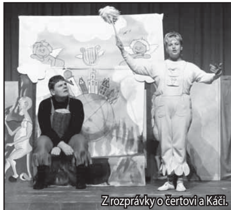
Z rozprávky o čertovi a Káci.

a trubičky, háčkované ozdoby, adventné vence, vianočné ozdoby a nechýbali ani pestrofarebné balóny pre najmenších. Počas tvorivých dielní sa návštevníkom venovali ľudoví remeselníci z nášho regiónu, ktorých výrobky sú známe v celom širokom okolí.