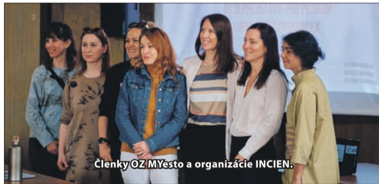
Členky OZ MYesto a organizácie INCIEN.