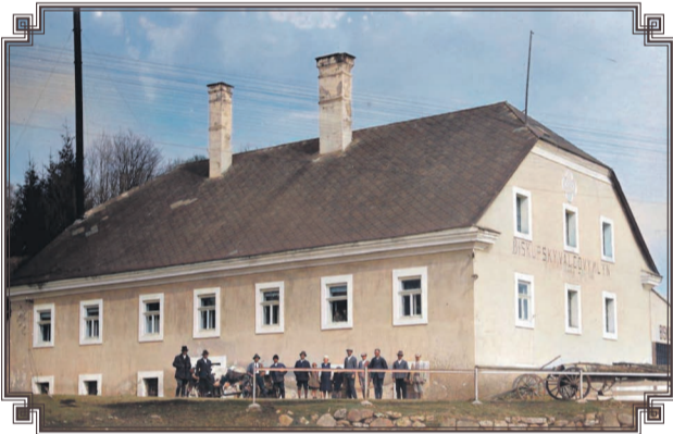
Budova mlyna stála až do požiaru v roku 1990, keď bol úmyselne zapálený, vyhořel a jeho ruiny boli sanované