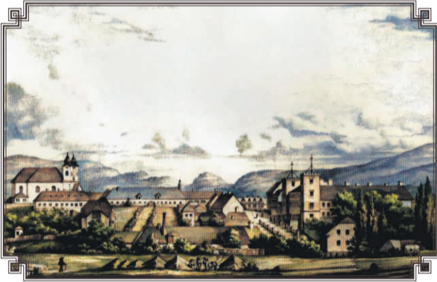
Pohľad na Svätý Kríž v roku 1861

Na fotografiách môžete vidieť, ako to asi v reálnom živote vyzeralo na dnešnej Ulici SNP, na Svätokrížskom námestí, či aký bol príchod sovietskych vojsk do mesta. Aj na vás dýchajú tieto fotografie nostalgiou? Ak máte vo svojom archíve historické fotografie, ktoré ešte neboli nikde publikované a sú svojím „príbehom“ zaujímavé aj pre náš archív, budeme radi, ak nám ich poskytnete a rovnako ako týmto zverejneným im vdýchnete život pomocou farieb. Zasielať ich môžete e-mailom na: mn@ziar.sk .