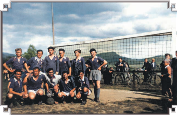
Futbal má v našom meste dlhú históriu