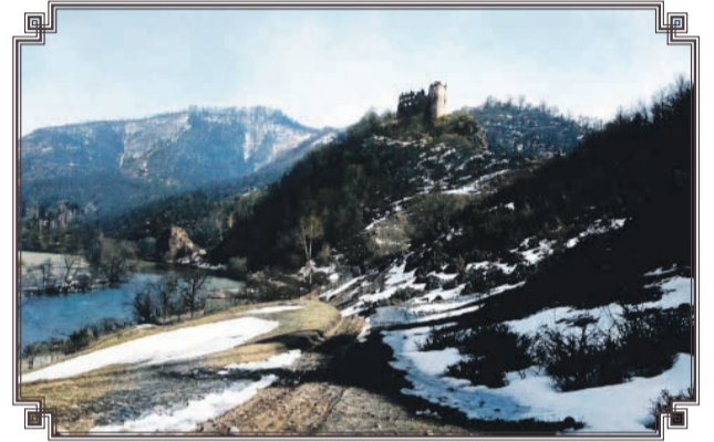
Hrad Šášov, rok 1930