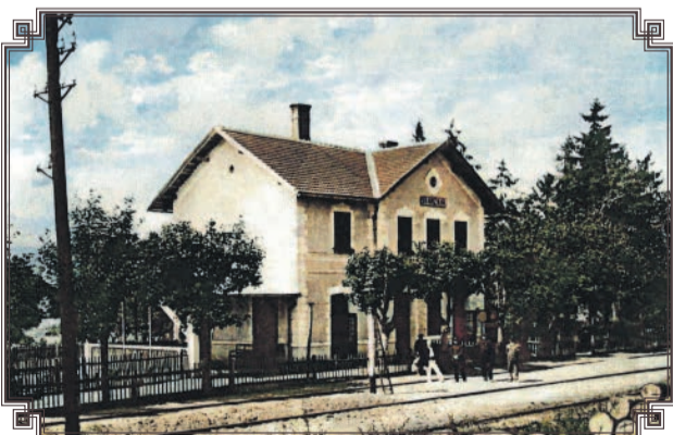
Vlaková stanica, Svätý Kríž nad Hronom, rok 1928