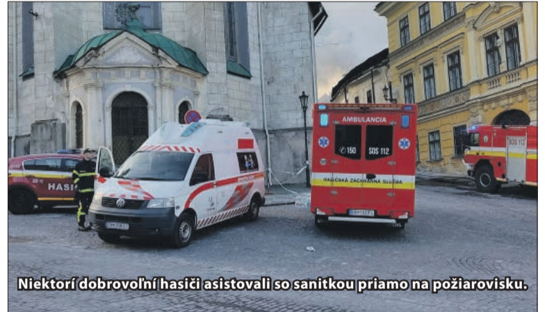
Niektorí dobrovoľní hasiči asistovali so sanitkou priamo na požiarovisku.