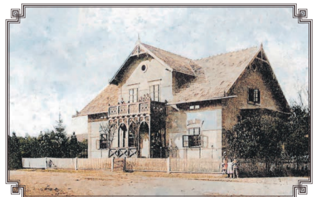
Vila Zimmermann, rok 1917. Pravdepodobne sa nachádzala v mieste terajšieho koryta Hrona