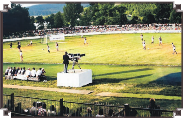
Stretnutie na Hrone, futbalový štadión v Žiari nad Hronom, 70. roky 20. storočia