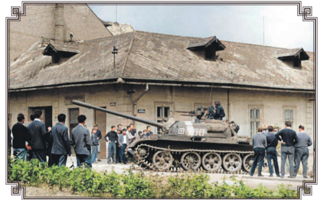
Vojská Varšavskej zmluvy v uliciach mesta, rok 1968