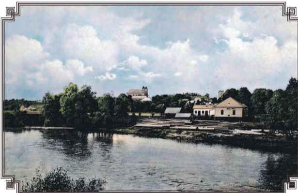
Pohľad na Svätý Kríž nad Hronom v roku 1928