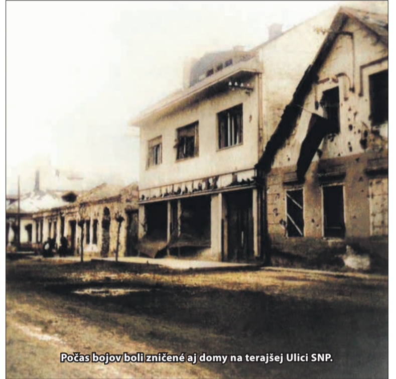
Počas bojov boli zničené aj domy na terajšej Ulici SNP.

Spojenecké armády spoločne porazili fašizmus, ale za výraznú pomoc pri jeho porážke a za oslobodenie našej vlas-