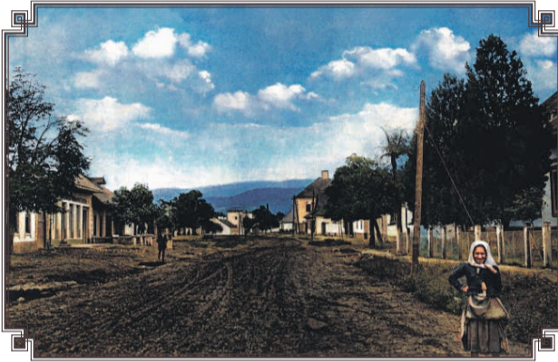
Pohľad na hlavnú ulicu, dnešnú Ul. SNP