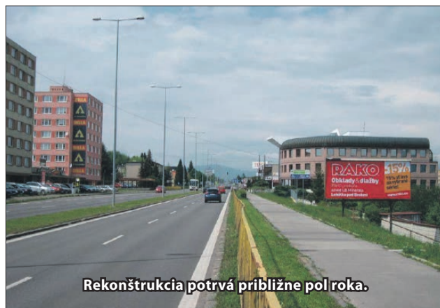
Rekonštrukcia potrvá približne pol roka.