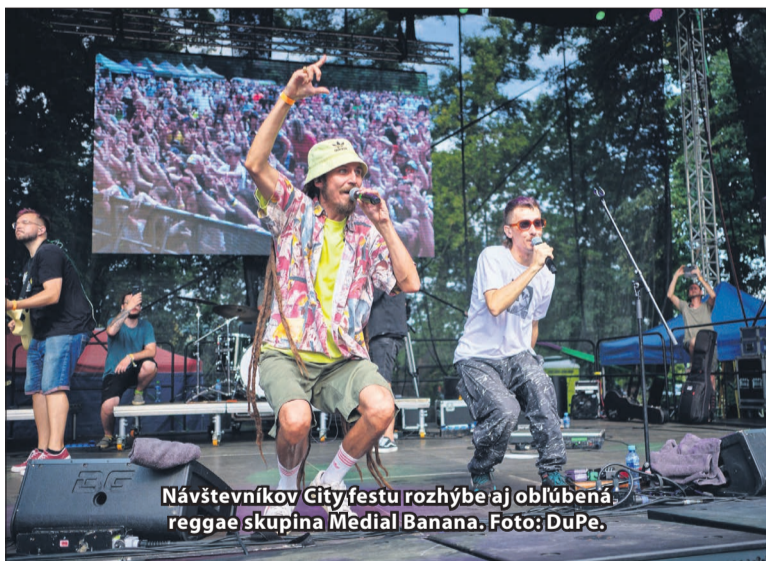
Návštevníkov City festu rozhybe aj obľúbená reggae skupina Medial Banana.