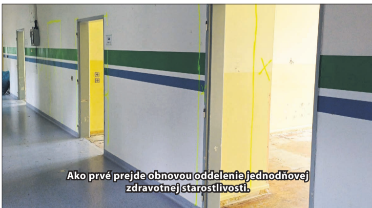
Ako prvé prejde obnovou oddelenie jednotňovej zdravotnej starostlivosti.