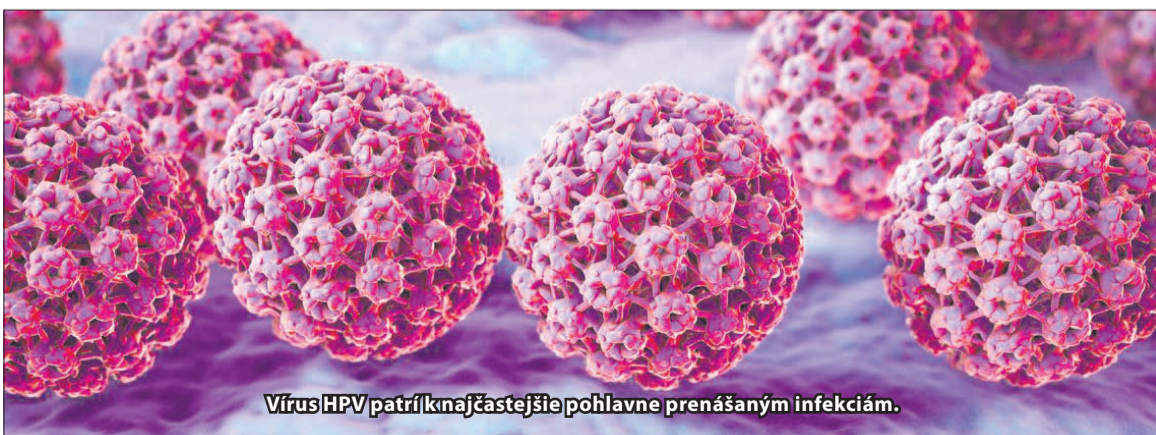
Vírus HPV patrí k najčastejšie pohlavne prenášaným infekciám.