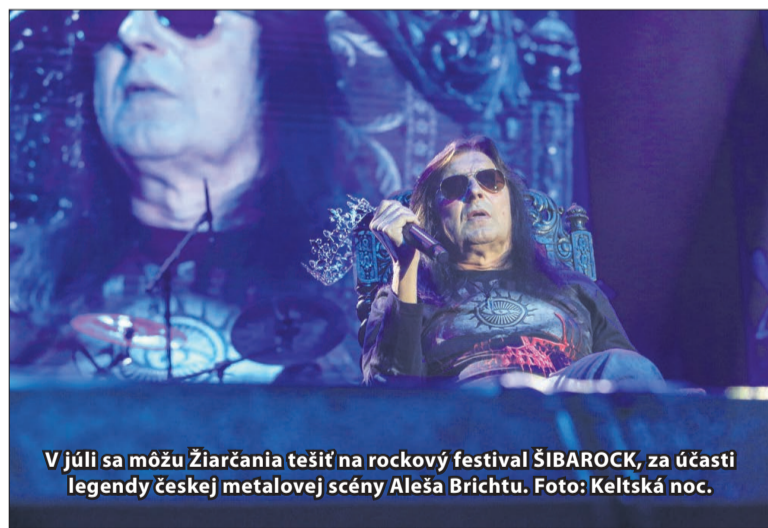
V júli sa môžu Žiarčania tešiť na rockový festival ŠIBAROCK, za účasti legendy českej metalovej scény Aleša Brichtu.