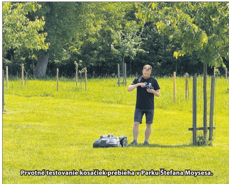
Prvotné testovanie kosačiek prebieha v Parku Štefana Moysesu.

„Kosačky sú vybavené GPS senzormi, ktoré im umožňujú navigovať po trávniku. Pomocou ohraničovacích káblov, inštalovaných na okrajoch koseného priestoru, vedia presne, kde môžu kosieť,“ vysvetlila projektová manažérka s tým, že kosačky sú na elektrický pohon, teda sú poháňané batériami, čo zabezpečuje ich tichý chod a ekologickú prevádzku. Keď je batéria vybitá, kosačka sa automaticky vráti do nabíjacej stanice. Ko-