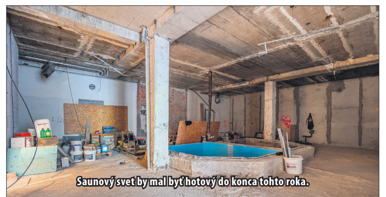
Saunový svet by mal byť hotový do konca tohto roka.