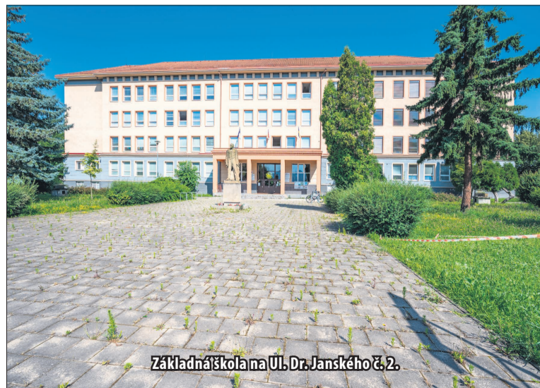
Základná škola na Ul. Dr. Janského č.2.