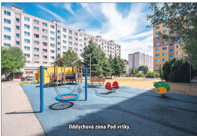
Oddychová zóna Pod vršky.

„Ďakujem pracovníkom mesta a Technickým službám v Žiari nad Hronom a spoločnosti Intersystem EU za opravu ihrísk na sídlisku Pod vršky. Je to už takmer päť rokov, čo boli tieto ihriská dané do užívania. Mrzí ma, že nie všetky závady boli spôsobené bežným