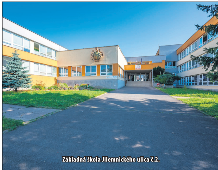
Základná škola Jilemnického ulica č.2.

vajú kvalitnou výučbou, láskavosťou, ale aj prítomnosťou našich pedagógov a taktiež neustále modernizované priestory našej cirkevnej školy,“ podotkol riaditeľ školy s tým, že budovu aj areál sa snažia priebežne zveľaďovať cez projekty alebo z vlastných zdrojov, táto aktivita počas prázdnin len kulminuje. „Najrozsiahlejšie práce sme urobili vo vestibule a v školskej jedálni. Vo vestibule tmavé obklady nahradila jasná biela farba stien, ktorá celý priestor presvetlila. Práve tam pribúdajú nové skrinky, keďže k nám prichádza väčší počet žiakov,“