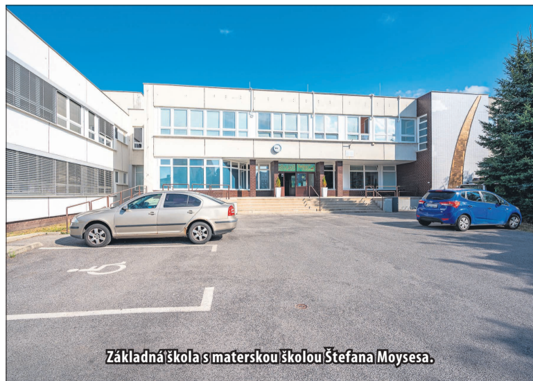
Základná škola s materskou školou Štefana Moyses.