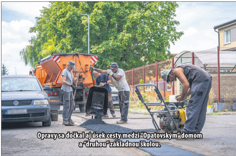
Opravy sa dočká aj úsek cesty medzi „Opatovským“ domom a „druhou“ základnou školou.