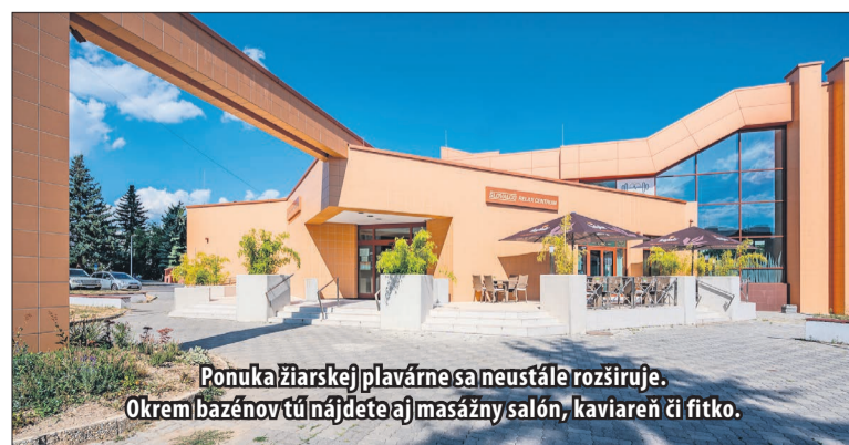
Ponuka žiarskej plavárne sa neustále rozširuje. Okrem bazénov tu nájdete aj masážny salón, kaviareň či fitko.