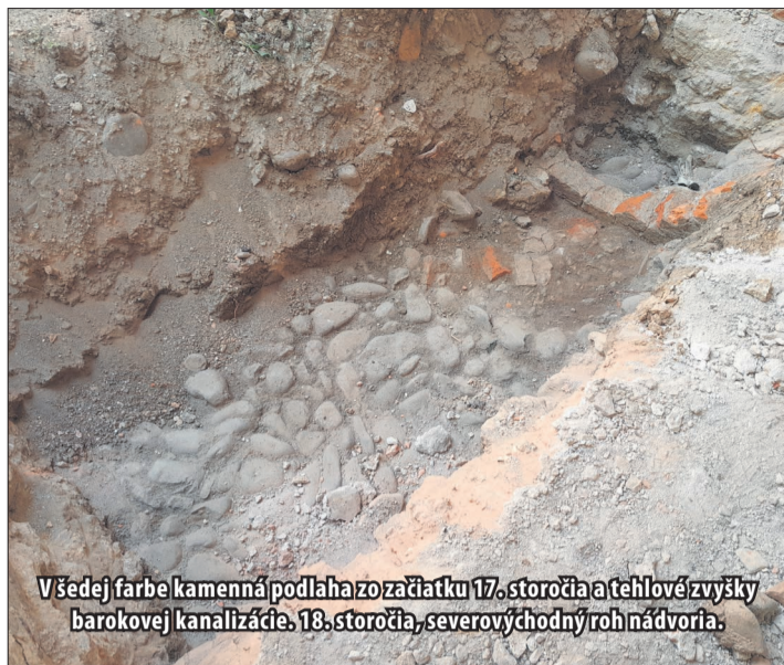
V šedej farbe kamenná podlaha zo začiatku 17. storočia a tehlové zvyšky barokovej kanalizácie, 18. storočia, severovýchodný roh nádvorja.

Do prvej kategórie patrí zatiaľ najstaršia objavená vrstva remeselne položených podlahy, nájdená pri jednom z arkádových stĺpov v severovýchodnom rohu nádvorja. Podľa hĺbky, v ktorej sa nachádza, ju archeológovia datovali do rokov 1610 - 1625, teda do čias, keď sa stavali základy a najstaršie časti kaštiela. Druhým hmotným nálezom je baroková, tehlová kanalizácia, smerujúca od budovy do stredu nádvorja, niekedy z osemdesiateho storočia, objavená na tom istom mieste.