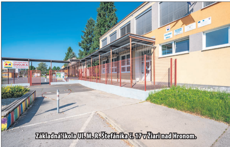
Základná škola Ul. M. R. Štefánika č. 17 v Žiari nad Hronom.

Čo sa spomínaných inovatívnych postupov týka, od septembra 2024 patrí žiarska „Štvorka“ k školám, ktoré sa zapájajú do postupného zavádzania nového Štátneho vzdelávacieho programu – kurikulárnej reformy od 1. ročníka. Pedagogovia sa na túto zmenu pripravujú zvyšovaním svojich profesionálnych kompetencií účasťou na vzdelávaní, ktoré pre nich realizuje NIVAM a RCPU.