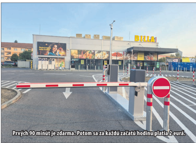
Prvých 90 minút je zdarma. Potom sa za každú začatú hodinu platia 2 eurá.

Parkovisko pred obchodným reťazcom funguje v štandardnom režime tak, ako pri ostatných prevádzkach. Prvých 90 minút je zdarma a následne zákazník platí 2 eurá za každú začatú hodinu. Rovnaký systém plateného parkovania