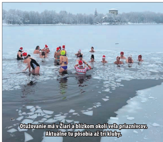
Otužovanie má v Žiari a blízkom okolí veľa priaznivcov. Aktuálne tu pôsobia až tri kluby.