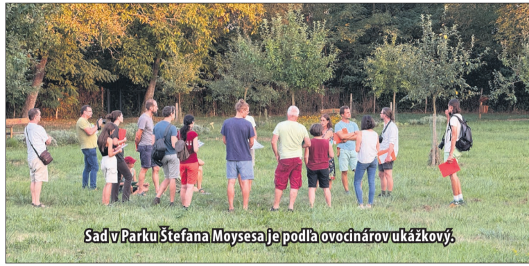
Sad v Parku Štefana Moysesu je podľa ovocinárov ukázkový.