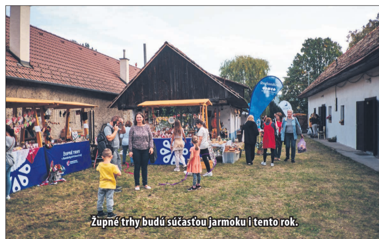
Župné trhy budú súčasťou jarmoku i tento rok.