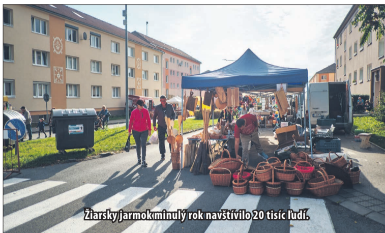
Žiarsky jarmok minulý rok navštívilo 20 tisíc ľudí.

Súčasťou jarmoku bude aj v tomto roku Remeselná ulička, ktorú návštevníci nájdu na konci ulice Š. Moysesa. „Aj tento rok sa do remeselnej uličky prihlásilo množstvo predajcov, ktorí predstavia svoje tradičné remeslá. Pre návštevníkov to bude príležitosť vidieť, ako sa vyrábajú rôzne výrobky, ktoré si následne budú môcť priamo od reme-