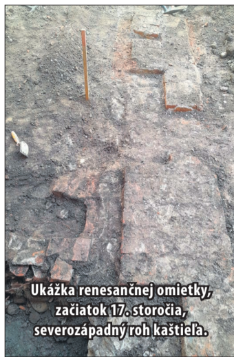
Ukážka renesančnej omietky, začiatok 17. storočia, severozápadný roh kaštiela.

V juhozápadnom rohu nádvorja sa začali objavovať pravidelne uložené tehly a zdalo sa, že sa tiahnu smerom ku kaplnke od miesta, kde si starší obyvatelia nášho mesta ešte môžu pamätať sklenené výplne medzi stĺpmi nádvorja. Profesionálny archeológ na žiadosť kastelána začal s odborným odkrývaním a rýchlo sa objavili kamenné základy, možno pochádzajúce z renesančného ob-