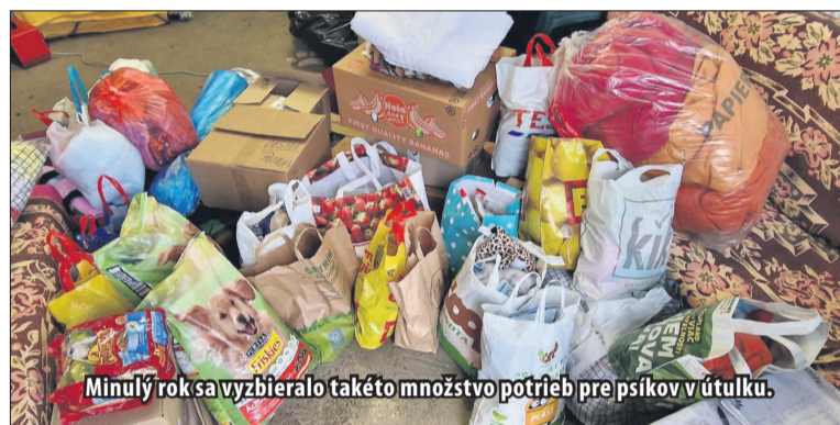
Minulý rok sa vyzbieralo takéto množstvo potrieb pre psíkov v útulku.

ky odnieť. Oslovili sme preto rodičov, žiakov, pedagógov, ale aj ostatných zamestnancov školy, aby v tejto zbierke pomohli,“ dodáva Tršová s tým, že počas tohto obdobia môžu žiaci, učitelia, rodičia žiakov, ako aj ostatní zamestnanci nosiť do školy či už materiálnu pomoc ako granule, krmivo, ryža, cestoviny, konzervy pre psov, pamlsky, čistiace prostriedky, rukavice, vedrá, dezinfekciu, staré a vyradené deky, uteráky, obliečky, savé podložky pre šteniatka, hračky, misky, vödzy či obojky alebo prispieť ľubovoľnou finančnou sumou, ktorá bude po ukončení zbierky spolu s materiálnymi darmi odovzdaná útulku. Ako ďalej dodáva učiteľka, aj minulý rok sa im podarilo vyzbierať 100 eur, no oveľa viac bolo vyzbieraných práve materiálnych vecí. „Krmiva, obliečok a kačičích sa vtedy vyzbieralo naozaj veľa. Myslím, že to bola veľmi pekná zbierka a deťom sa to naozaj páčilo,“ dodáva učiteľka s tým, že tohtoročná zbierka je už v plnom prúde. „Už teraz nosia kopy materiálnych vecí. Na škole máme veľa psíčkarov, takže pevne verím, že sa úspech z minuloročnej zbierky zopakuje. Tiež sme sa so žiakmi dohadovali na tom, že psíkov pôjdeme vyvenčiť a aj takýmto spôsobom sa o nich postaráme a spojíme viac vecí dohromady. Je to niečo pekné, charitatívne, vo vianočnom období, ktoré nás za chvíľu čaká,“ dodáva Tršová a zároveň podotýka, že snaha