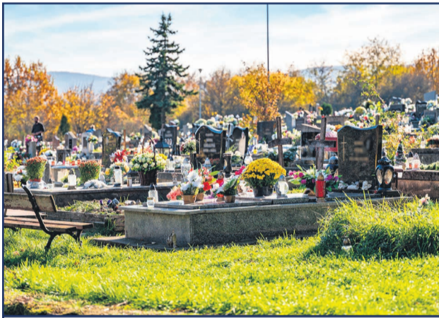
V dňoch 1. a 2. novembra si veriaci spomenuli na svojich príbuzných, ktorí už nie sú medzi nami a položili im na hroby kahance, vence či kytice.