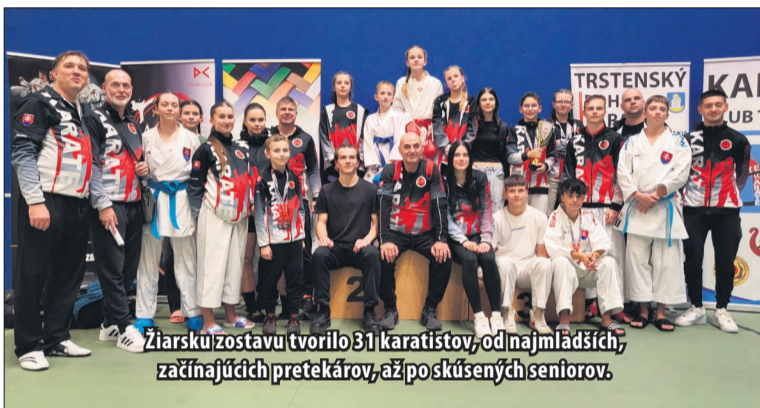
Žiarsku zostavu tvorilo 31 karatistov, od najmladších, začínajúcich pretekárov, až po skúsených seniorov.

V športovom zápase KUMITE sme mali oveľa silnejšie zastúpenie a tom svedčia aj naše výsledky. Zlato si vybojovali