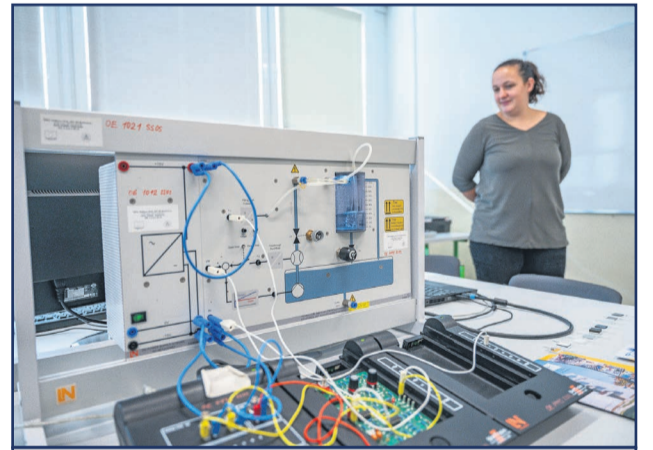
V stredu 6. novembra sa v Súkromnej strednej odbornej škole technickej v Žiari nad Hronom uskutočnil Deň otvorených dverí.