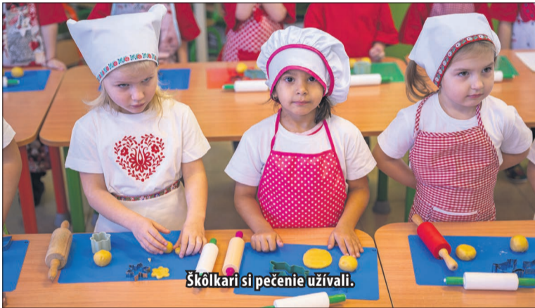
Škôlkari si pečenie užívali.