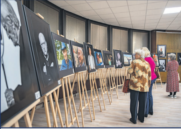
Dňa 8. novembra sa vo výstavnej sieni MsKC konala vernisáž výstavy ART-ISTI fotografa Gustu Hegeduša a výtvarníka Dáriusa Bónu.