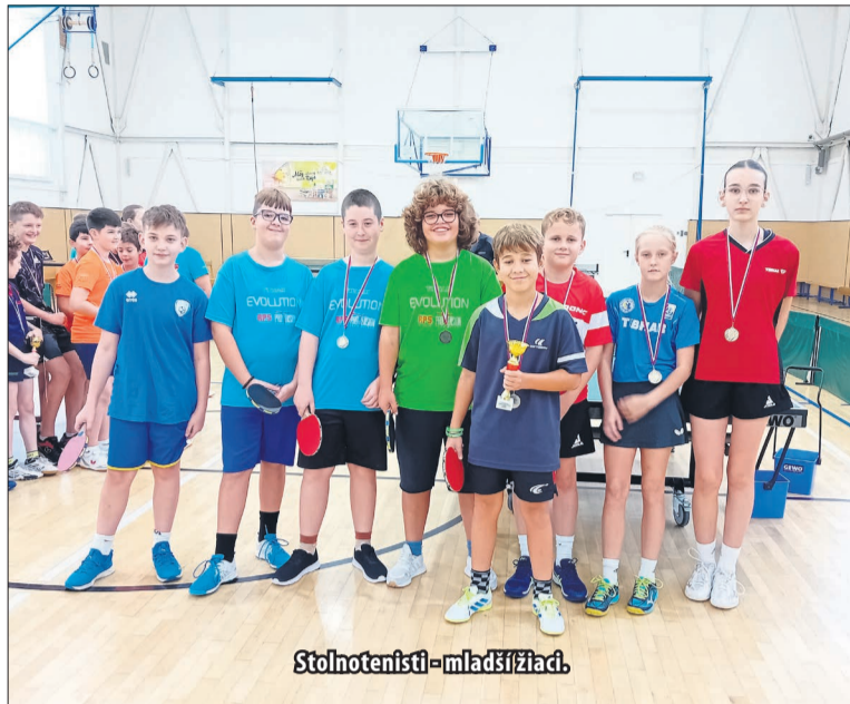
Stolnotenisti - mladší žiaci.

V domácom prostredí sme poriadali 1. turnaj extraligy zmiešaných družstiev mladšieho žiactva. Turnaja sa okrem nášho mužstva zúčastnili ešte družstvá z Námestova, Kalinova, Bošian, Turčianskych Teplic a Lučenca. Naše družstvo