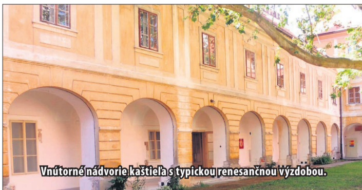
Vnútorné nádvorie kaštieľa s typickou renesančnou výzdobou.

Gotický štýl je vertikálny, teda zameraný na zvislosť stavieb a kladie dôraz na štihlosť. Náš kaštieľ, keďže je renesančný, je naopak, postavený do šírky a je nižší. Gotické fasády sú