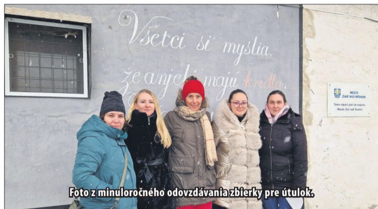
Foto z minuloročného odovzdávania zbierky pre útulok.