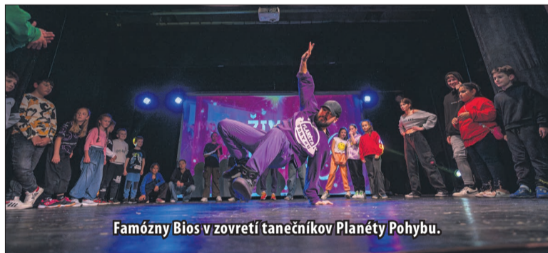
Famózný Bios v zovretí tanečníkov Planéty Pohybu.