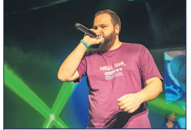
V stredu 6. novembra sa uskutočnilo podujatie Život v pohybe 3. Vystúpil na ňom aj hudobník Zlatý Lev, ktorý mal pod palcom aj tvorivú dielňu, kde si mohli návštevníci napísať svoj vlastný text.