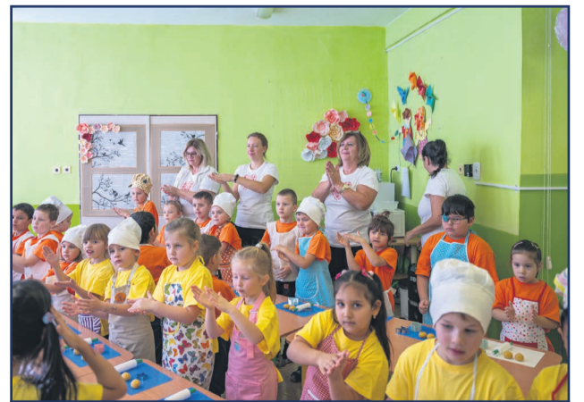
Už po druhýkrát sa materská škola na Ul. Andreja Kmeťa v Žiari nad Hronom premenila na voňavú pekárňu počas akcie s názvom Pečie celá škôlka.