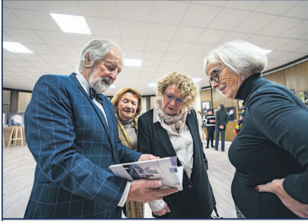
Výstava fotografa Gustu Hegeduša a výtvarníka Dáriusa Bónu potrvá do 2. januára 2025.