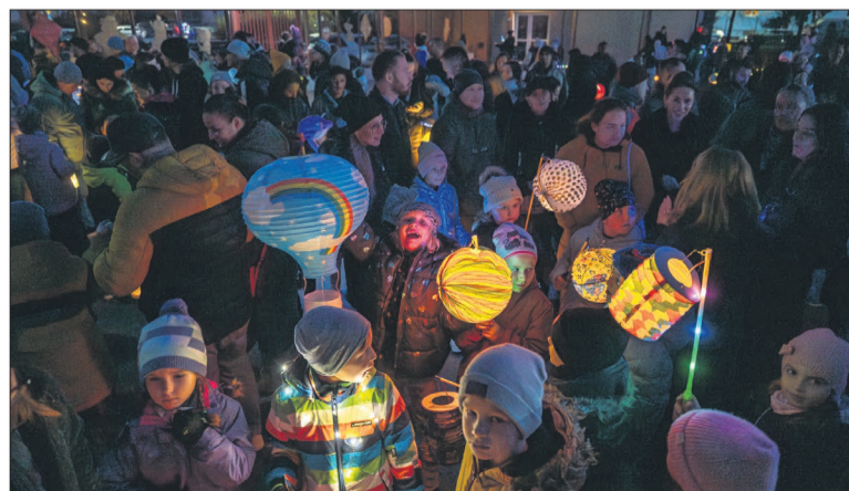
Lampiónový sprievod rozžiaril ulice mesta.

mesta. Trasa lampiónového sprievodu viedla z Ul. M. R. Štefánika cez A. Dubčeka, pokračovala popri hlavnej ceste SNP a po ulici Dr. Janského cez Námestie Matice slovenskej naspäť na dvor základnej školy.