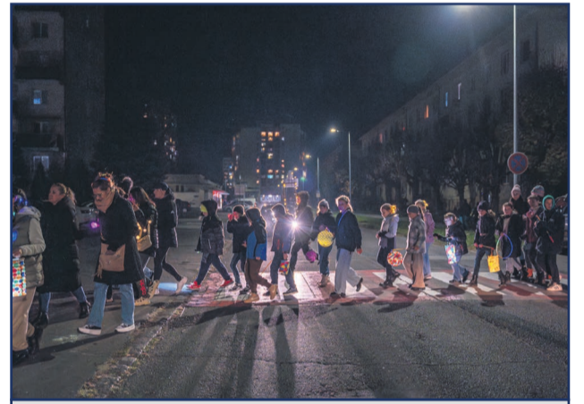
Sprievodu sa mohol zúčastniť ktokoľvek, organizátorov tento rok potešila bohatá účasť.