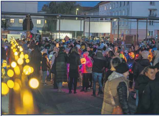
Vo štvrtok 7. novembra podvečer, zorganizovala žiarska "Dvojka" Lampiónový sprievod, ktorý rozžiariť ulice mesta.