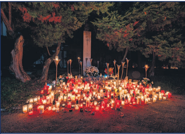
Takto sa rozsvietil žiarsky cintorín počas Sviatku všetkých svätých a Pamiatky zosnulých.