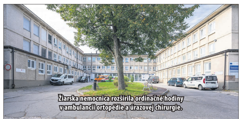
Žiarska nemocnica rozšírila ordinačné hodiny v ambulancii ortopedie a úrazovej chirurgie.