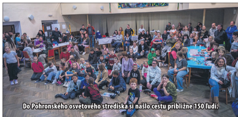
Do Pohronského osvetového strediska si našlo cestu približne 150 ľudí.