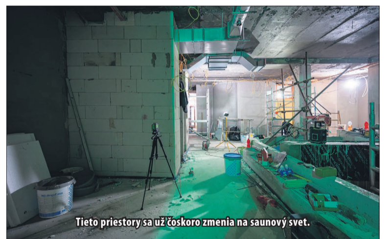
Tieto priestory sa už čoskoro zmenia na saunový svet.

Projekt počíta aj s vybudovaním privátnej časti saunového sveta, ktorý bude tvoriť fínska sauna, ochladzovací bazén a solná kabína. Táto privátna časť sa bude dať prenajať, ako pre menšie skupiny, tak pre páry. V čase, keď privátna sauna nebude využívaná pre uzavretú spoločnosť, sa tieto priestory stanú súčasťou verejnej sauny.