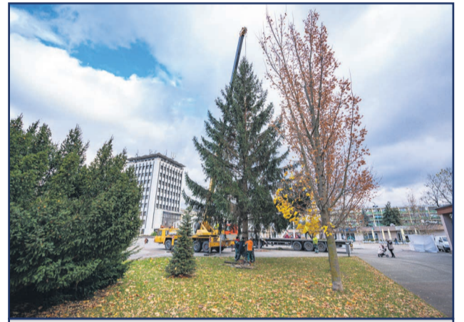
Vianočný stromček spolu s výzdobou rozsvieti Mikuláš už 5. decembra.