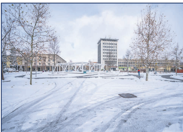
Takto sa Žiar počas novembra aspoň na pár dní zahalil do bielej snehovej pokrývky.