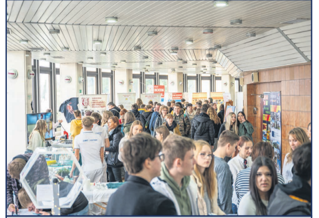
Stredoškolač prilákal do MsKC desiatky žiakov 8. a 9. ročníkov a ich rodičov.