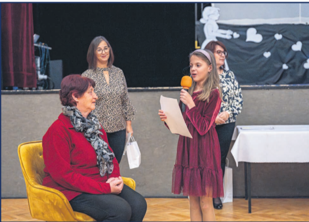
14. novembra v MsKC Centrum voľného času zorganizovalo vyhodnotenie 20. ročníka výtvarno – literárnej súťaže Mám svojich starých veľmi rád.