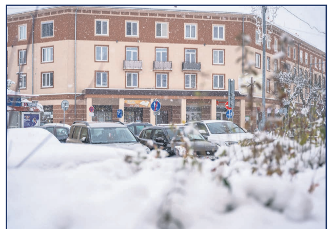
Čo myslíte, bude sneh v Žiari na Vianoce alebo nie?