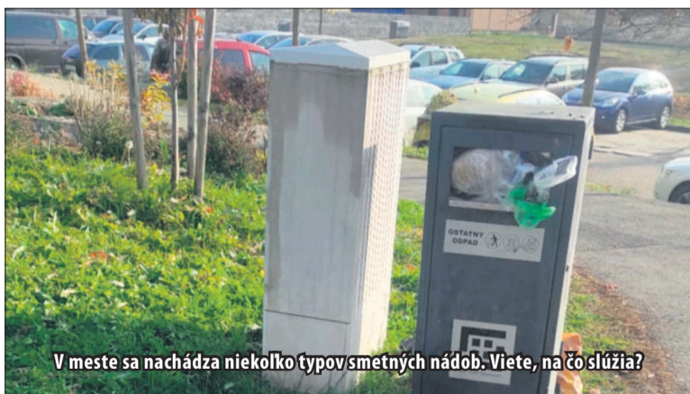
V meste sa nachádza niekoľko typov smetných nádob. Viete, na čo slúžia?

Mesto Žiar nad Hronom v poslednej dobe zaznamenalo čoraz častejší výskyt vzniku čiernych skládok v okolí malých smetných košov, ktoré sú rozmiestnené na verejnom priestranstve mesta.