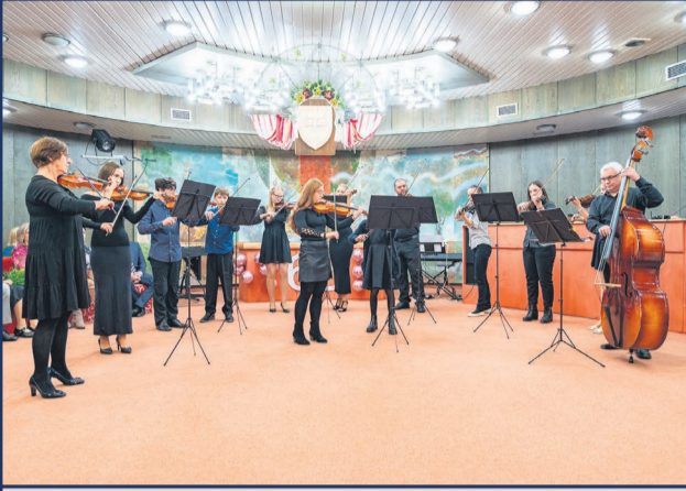
Žiarska ZUŠ-ka oslávila 65. výročie od svojho vzniku.