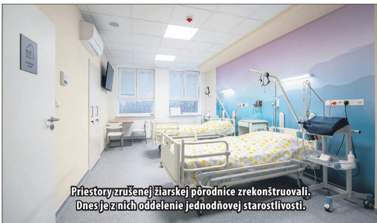
Priestory zrušenej žiarskej pôrodnice zrekonštruovali. Dnes je z nich oddelenie jednotňovej starostlivosti.

Ako sme už spomínali vyššie, na tejto chodbe bolo ešte pred rekonštrukciou prevádzkované gynekologicko-pôrodnické oddelenie, ktoré takto zhruba pred rokom ukončilo svoju činnosť. „Bolo to výlučne z personálnych dôvodov, pretože zdravotná starostlivosť, ktorá tu bola poskytovaná, rozhodne nebola bezpečná. Ak vám oddelenie stojí na jednom