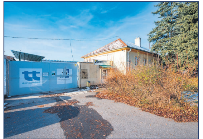
Mesto po zámene pozemkov získa do svojho vlastníctva areál Technických služieb a.s. na Ul. SNP.