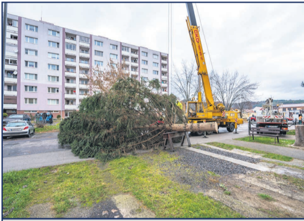
Vianočný stromček je už na námestí, takto vyzerala jeho cesta zo sídliska Hviezdoška.