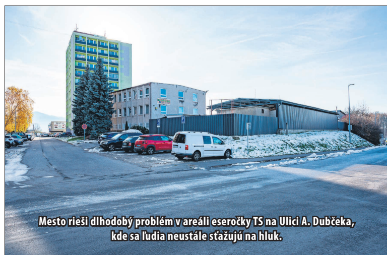
Mesto rieši dlhodobý problém v areáli eseročky TS na Ulici A. Dubčeka, kde sa ľudia neustále sťažujú na hluk.