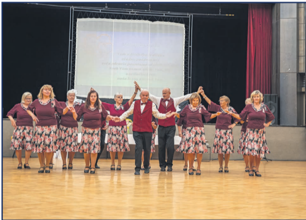
Vyhodnotenie literárno-výtvarnej súťaže Mám svojich starých veľmi rád sprevádzal aj kultúrny program, o ktorý sa postarali naši žiarski seniori Optimisti.