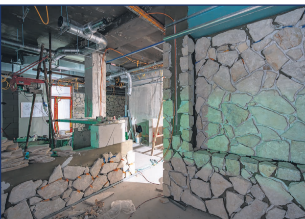
Práce na rekonštrukcii saunového sveta krok za krokom: V januári by mohla byť kolaudácia, od februára by sauny mohli byť prístupné verejnosti.