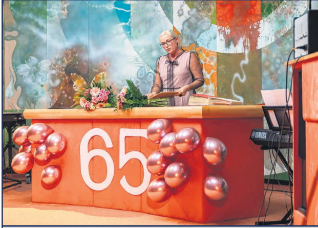
Žiarska ZUŠ-ka si slávnostným koncertom v Obradnej sieni v MsKC pripomenula, že už uplynulo neuveriteľných 65 rokov od jej založenia.