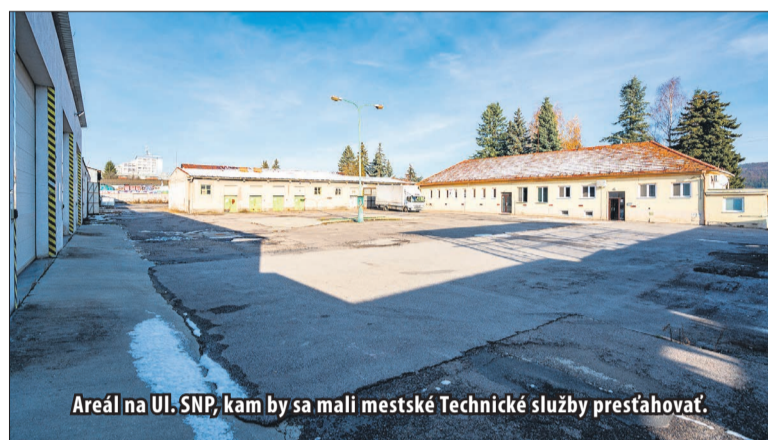
Areál na Ul. SNP, kam by sa mali mestské Technické služby presťahovať.

Mestskí poslanci schválili na novembrovom zasadnutí MsZ zámer, týkajúci sa zámény pozemkov medzi spoločnosťou T+T zaoberajúcou sa zhodnocovaním odpadov a mestom Žiar nad Hronom. Čo to v praxi bude znamenať? Mestské technické služby budú mať väčší areál a presťahujú sa z Ul. A. Dubčeka do priestorov TS a.s. na Ulici SNP a mesto zamení spoločnosti T+T Centrum zhodnocovania odpadov, ktoré tejto istej firme prenajalo ešte v roku 2022 na dlhodobý prenájom.