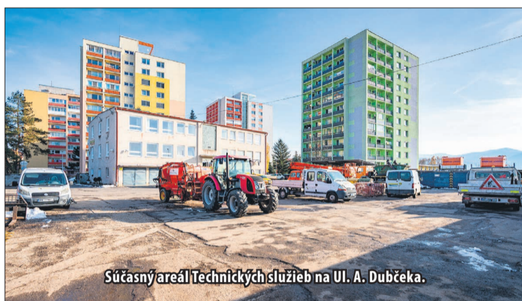
Súčasný areál Technických služieb na Ul. A. Dubčeka.