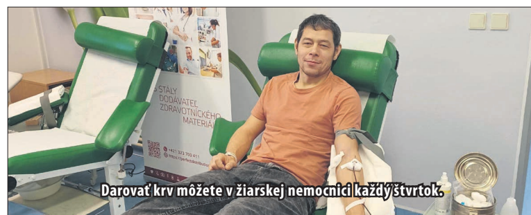
Darovať krv môžete v žiarskej nemocnici každý štvrtok.

1. Deň pred tým, ako sa rozhodnete ísť darovať krv, pite veľa tekutín a nejedzte masť a ťažké jedlá. Myslite na to, že krv môžete darovať len v tom prípade, ak máte viac ako 50kg.