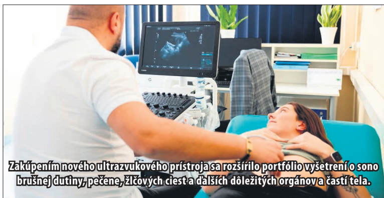
Zakúpením nového ultrazvukového prístroja sa rozšírilo portfólio vyšetrení o sono brušnej dutiny, pečene, žlčových ciest a ďalších dôležitých orgánov a častí tela.