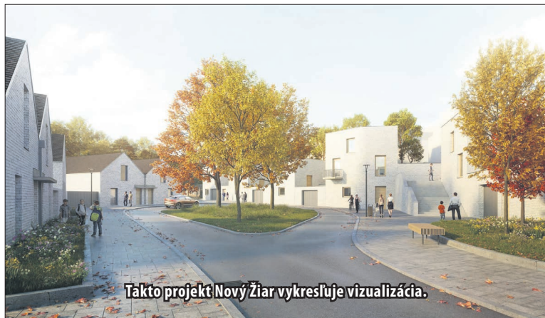
Takto projekt Nový Žiar vykresľuje vizualizácia.