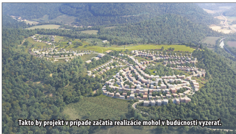
Takto by projekt v prípade začatia realizácie mohol v budúcnosti vyzerieť.

V zóne „Dedinka“ nachádzajúcej sa za vodojemom (Šibeničný vrch) bude na rovinatých parcelách umiestnená experimentálna ekologická dedinka, kde je navrhované bývanie v 35 rodinných domoch a 3 stavby s občianskou vyba-