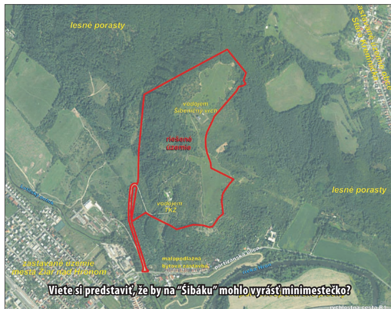
Viete si predstaviť, že by na „Šibáku“ mohlo vyrásť minimestečko?

situované mimo zastavaného územia mesta, územie Šibeničného vrchu je už od roku 2009, kedy bol schválený územný plán mesta, súčasťou územia určeného na zastavanie – sú súčasťou jednej z najväčších rozvojových lokalít bytovej výstavby s názvom „Nový Žiar“, to znamená, že na tomto území môže byť umiestnená výstavba, za podmienky, že developer dodrží funkčné využitie plôch v zmysle plat-