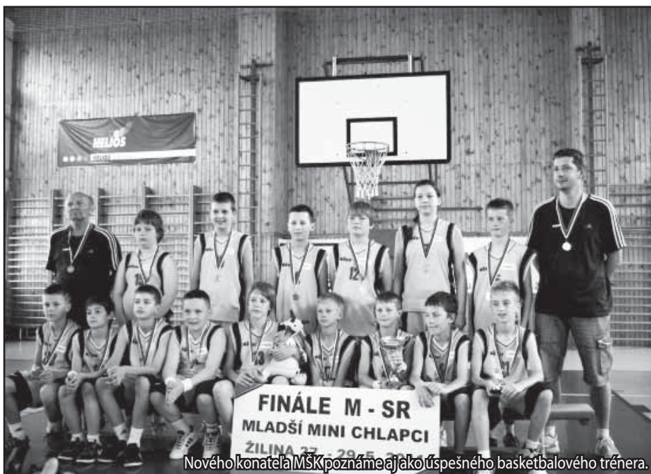
Nového konateľa MŠK poznáme aj ako úspešného basketbalového trénera.