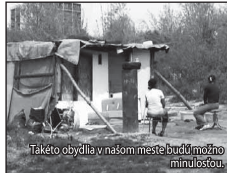
Takéto obydľia v našom meste budú možno minulosťou.