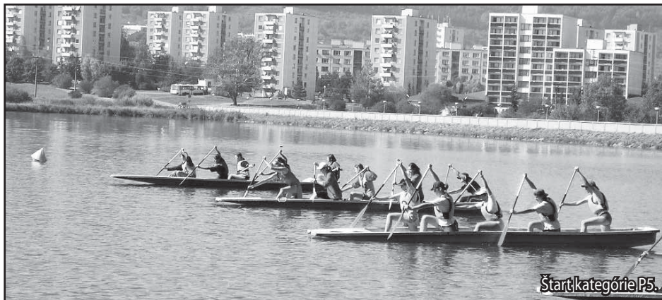
Štart kategórie P5.

Deti sa musia naučiť správne sedieť či kľačať v lodi, držať pádlo a naučiť sa ho dobre používať.