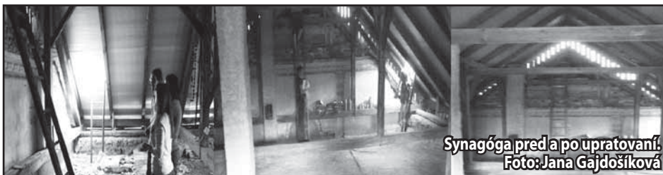
Synagóga pred a po upratovaní.

Čas plynie rýchlo a už je niekoľko dní minulosťou i malá dobrovoľnícka aktivita, ktorej cieľom bolo vyčistenie zanedbaných pozostatkov bývalej židovskej synagógy.