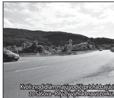
Kvôli zvodidlám majú vodiči prichádzajúci zo Šášova - Píly zlý výhľad na vozovku.

Národná diaľničná spoločnosť ani dopravný inšpektorát teda v predmetnej križovatke problém nevidia. Vodiči, ktorí po komunikácii jazdia denne, to však vidia inak. (li)