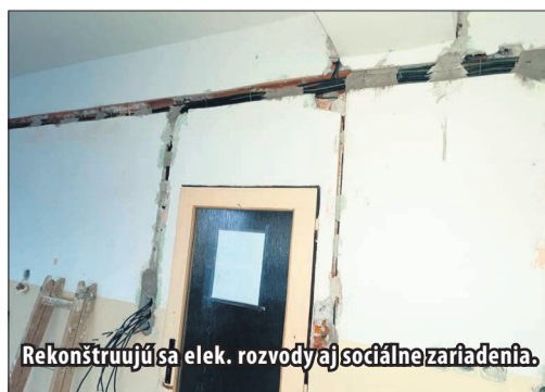
Rekonštruujú sa elek. rozvody aj sociálne zariadenia.