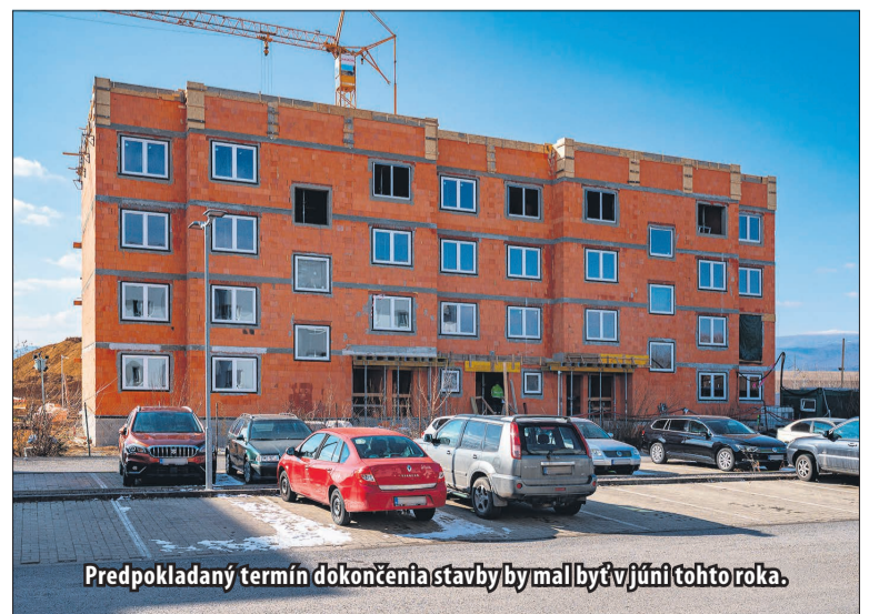
Predpokladaný termín dokončenia stavby by mal byť v júni tohto roka.