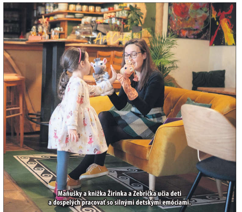
Maňušky a knižka Žirinka a Zebrička učia deti a dospelých pracovať so silnými detskými emóciami.