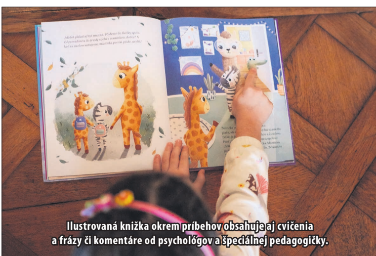
Ilustrovaná knižka okrem príbehov obsahuje aj cvičenia a frázy či komentáre od psychológov a špeciálnej pedagogičky.