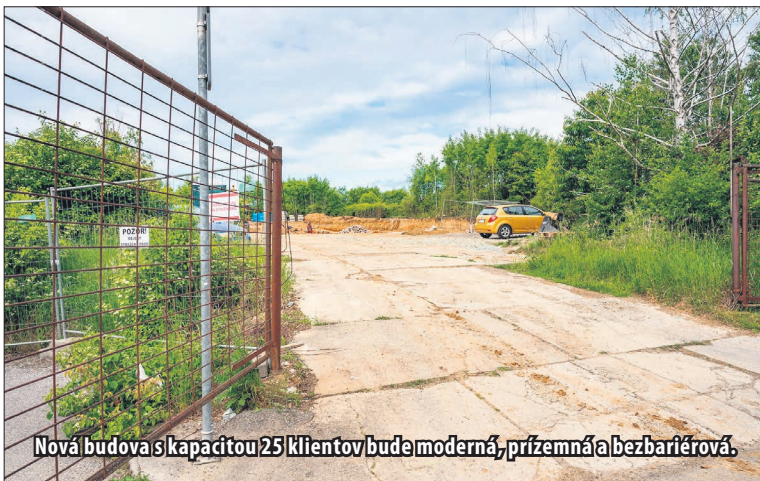
Nová budova s kapacitou 25 klientov bude moderná, prízemná a bezbariérová.

Ako sme sa ďalej dozvedeli, malo by ísť o modernú, prízemnú a plne bezbariérovú budovu s kapacitou 25 klientov, s dostatočnými priestormi pre terapie, záujmovú činnosť a oddych, ako aj so