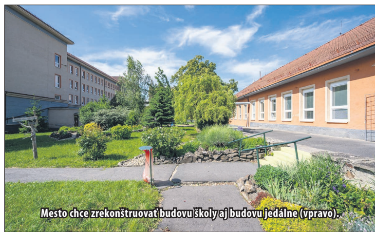
Mesto chce zrekonštruovať budovu školy aj budovu jedálne (vpravo).