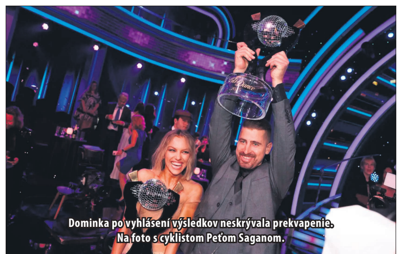
Dominka po vyhlásení výsledkov neskrývala prekvapenie. Na foto s cyklistom Peťom Saganom.