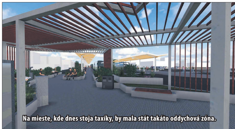
Na mieste, kde dnes stoja taxíky, by mala stáť takáto oddychová zóna.