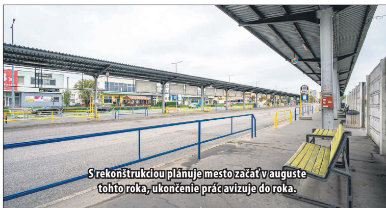
S rekonštrukciou plánuje mesto začať v auguste tohto roka, ukončenie prác avizuje do roka.

„Časovo môžeme výstavbu rozdeliť na dve hlavné etapy, pričom prvá etapa predstavuje severovýchodnú časť územia. Jedná sa o priestor Nástupišťa I a oddychovú zónu. Vzhľadom na fakt,