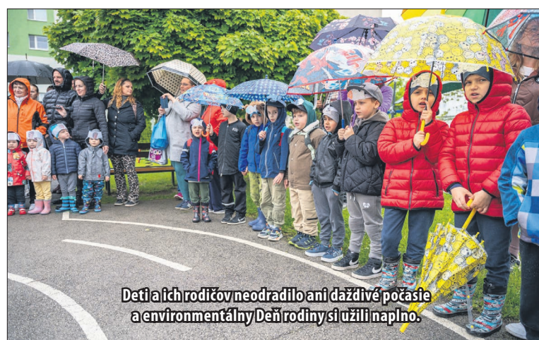
Deti a ich rodičov neodradilo ani daždivé počasiu a environmentálny Deň rodiny si užili naplno.