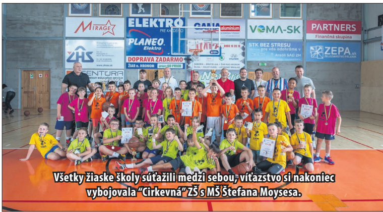
Všetky žiarske školy súťažili medzi sebou, víťazstvo si nakoniec vybojovala „Cirkevná“ ZŠ s MŠ Štefana Moyses.

NEMAK Žiarska basketbalová mikroliga začala už v marci, keď sa na „Cirkevnej“ konalo 12.3.2025 prvé kolo. Druhé kolo sa hralo 26.3.2025 na „Dvojke“, 2. apríla sa tretím kolom pokračovalo na „Štvorku“ a štvrté kolo si žiaci zahrali 23. apríla na „Jednotke.“ Spomínané finále sa konalo 14. mája v ZUS aréne.