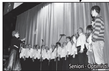
Seniori - Optimisti.

Poslednú októbrovú stredu pripravilo mesto Žiar nad Hronom v spolupráci s Mestským kultúrnym centrom podujatie pre jubilantov z mesta. Pozvánky dostalo 481 žiarčanov.