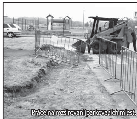
Práce na rozširovaní parkovacích miest.