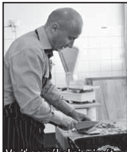
Variť pomáhal aj primátor.