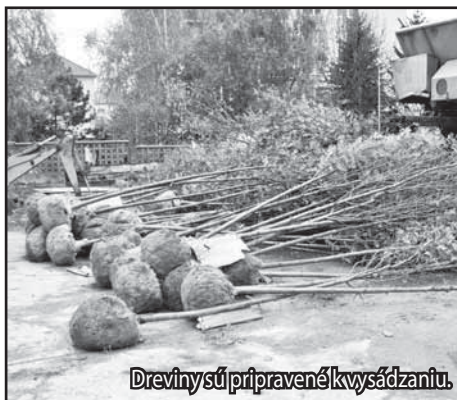
Dreviny sú pripravené kvysádzaniu.

V rámci náhradnej výsadby za výrubu starých stromov, ktoré realizovalo mesto pri revitalizácii námestia, sa na území Žiaru nad Hronom vysádzajú nové dreviny.