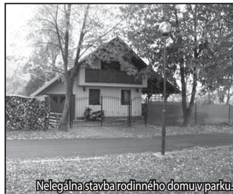
Nelegálna stavba rodinného domu v parku.