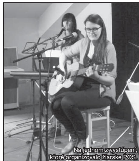
Na jednom z vystúpení, ktoré organizovalo žiarske POS.

Ten duch, ten duch, prišiel z mojej mysle. Ghost, Ghost, Coming from my head.