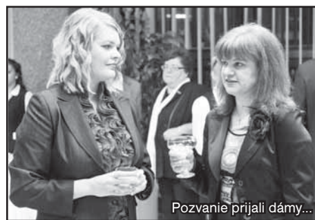
Pozvanie prijali dámy...