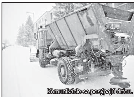
Komunikácie sa posypajú drťou.