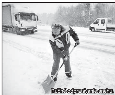
Ručné odpratávanie snehu.

Od prvého výkonu zimnej údržby sa na údržbu ciest minulo približne 300 ton posypového materiálu. „Posypa sa drveným kamenivom frakcie 0-4 a 4-8 a technickou soľou, ktorá sa používa len v prípade poľadovice a na rizikové úseky (kopce). Posypová soľ sa však používa len lokálne, a to kvôli záťaži na životné prostredie a aj kvôli vysokej cene,“