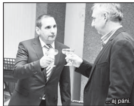
... aj páni.