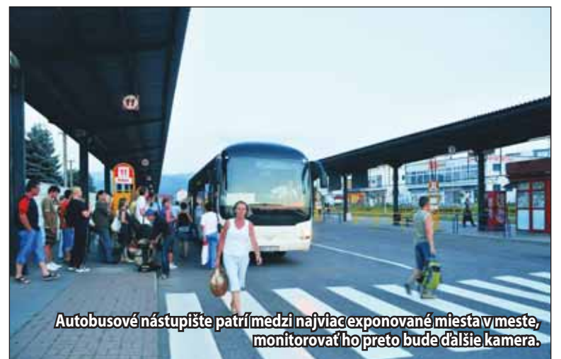
Autobusové nástupište patrí medzi najviac exponované miesta v meste, monitorovať ho preto bude ďalšia kamera.

Keďže obe kamery sa stanú súčasťou Mestského kamerového systému, ich obsluha bude zabezpečená zriadenou chránenou dielňou s pracovníkmi so zníženou pracovnou schopnosťou. V súčasnosti v chránenej dielni pracuje 6 ľudí.