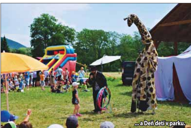
...a Deň detí v parku.