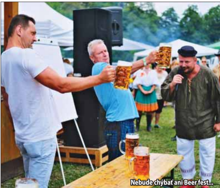
Nebude chýbať ani Beer fest...

Program Plant Simulation využíva SSOŠT už od 1.9.2018. Od začiatku sa stretáva s veľmi pozitívnymi ohlasmi tak od učiteľov, ako aj od študentov. Žiarska technická škola patrí medzi zatiaľ nevelký počet slovenských škôl, ktoré takúto inováciu využívajú. Nateraz je zaradený v odbore Technické lýceum, ktorý na základe požiadavky priemyselných firiem pripravuje svojich absolventov pre ďalšie štúdium na vysokých školách technického zamerania. (r)