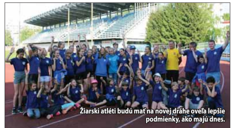
Žiarski atléti budú mať na novej dráhe oveľa lepšie podmienky, ako majú dnes.

Keďže nová atletická dráha bude 300-metrová a aj podmienky na nej budú podstatne kvalitnejšie, atléti by na „Jednotke“ chceli zachovať aspoň existujúcu 250-metrovú škarovú dráhu, ktorá by slúžila najmä na tréningy malých detí od 4,5 do 8 rokov. Tie by chodili na „Štvorku“ minimálne 1-krát týždenne. Ostatné deti budú mať tréning päťkrát do týždňa v nových priestoroch. (li)