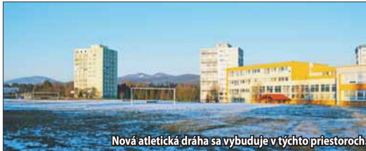
Nová atletická dráha sa vybuduje v týchto priestoroch.

Nová atletická dráha sa vybuduje v priestore, kde bola aj pôvodná, len sa viac posunie k detskému ihrisku. Prioritne pôjde o školskú atletickú dráhu, ale na organizovanie súťaží či na tréningy ju bude využívať aj už spomínaný atletický klub. „Pri projektovaní sme brali do úvahy aj pripomienky žiarskych atlétov. Tí pôvodne požadovali 400-metrovú