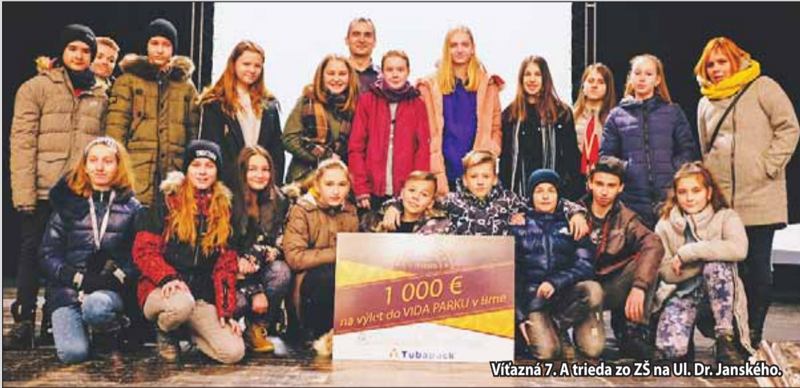
Víťazná 7. A trieda zo ZŠ na Ul. Dr. Janského.

Víťaznou triedou sa stala 7. A trieda zo Základnej školy na Ulici Dr. Janského 2, ktorá z túb vytvorila erb mesta Žiar nad Hronom. Za svoju prácu si žiaci odniesli