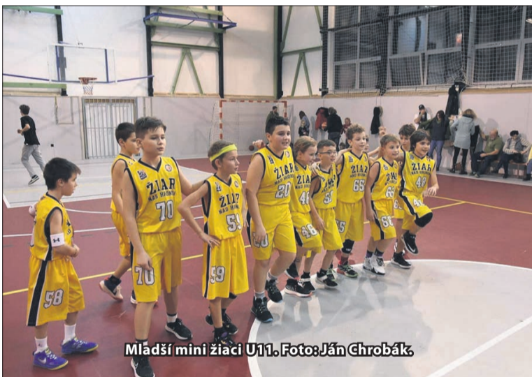
Mladší mini žiaci U11.