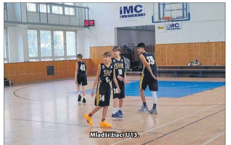
Mladší žiaci U13.