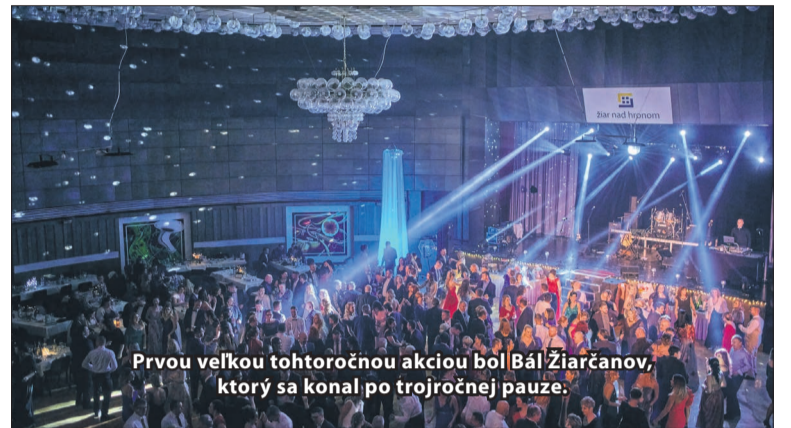
Prvou veľkou tohtoročnou akciou bol Bál Žiarčanov, ktorý sa konal po trojročnej pauze.