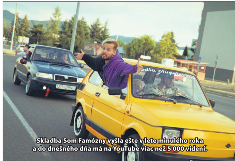
Skladba Som Famózný vyšla ešte v lete minulého roka a do dnešného dňa má na YouTube viac než 5 000 videní.

Ako Bios zdôrazňuje, všetko sa snaží robiť kvalitne, aby to pre ľudí malo zmysel po viacerých stránkach. Vedel, že nie je hudobník, skladateľ, spevák ani rapper. Preto potreboval niekoho, kto mu s piesňami pomôže. „Zamýšľal som sa, kto taký je v meste naprieč hudobnou sférou, hlavne v urban kultúre. Napadlo mi, že kedysi dávno tu bola hudobná skupina Nová Komunita. Boli to chalani, ktorí mali asi ako jediní v meste, až do dnešnej doby, zmysluplné texty s hlbokými myšlienkami a presne to som ja