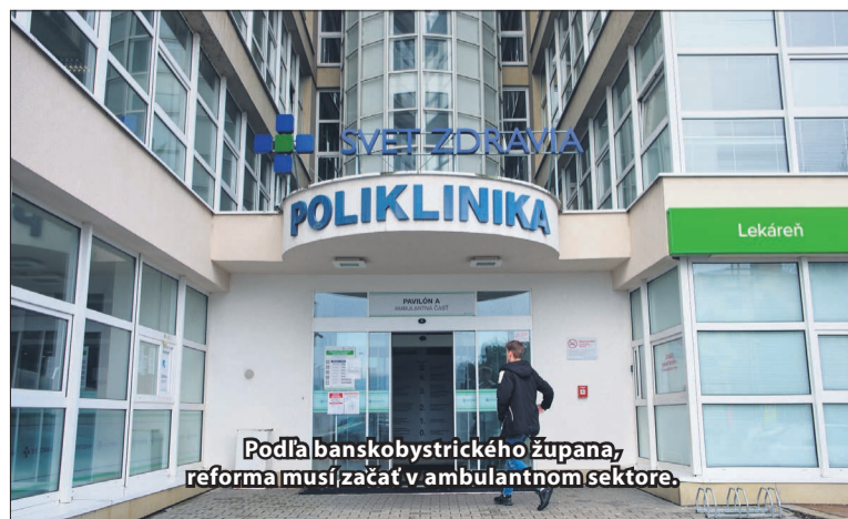
Podľa banskobystrického župana, reforma musí začať v ambulantom sektore.

„Ak aj naša nemocnica bude aj v kategórii č. 1, služby, ktoré poskytuje dnes, by mali ostať zachované.“