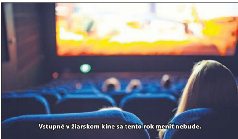
Vstupné v žiarskom kine sa tento rok meniť nebude.