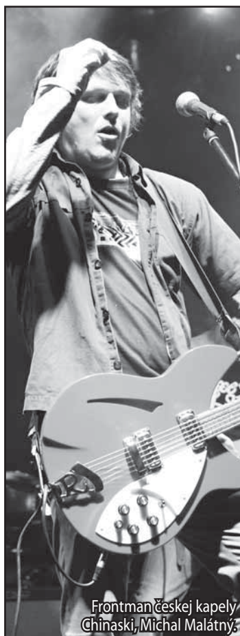
Frontman českej kapely Chinaski, Michal Malátný.