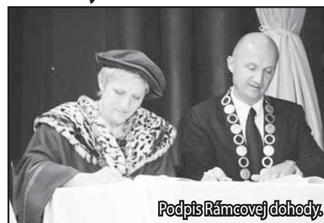
Podpis Rámcovej dohody.